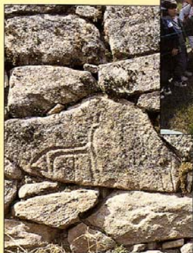
Yecla de Yeltes

Un viaje desde los castros prehistóricos