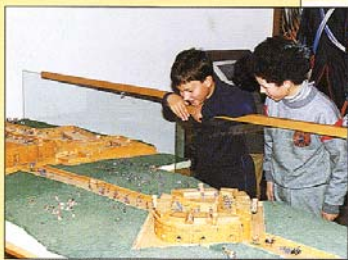
Aldea del Obispo