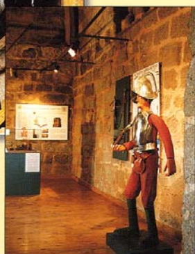
San Felices de los Gallegos