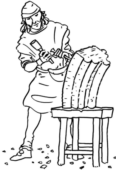
Figura de un cantero labrando la piedra con un cincel y una maza.

Fueron varios los arquitectos que dirigieron las obras, pero los más destacados fueron Juan Gil de Hontañón y su hijo Rodrigo.