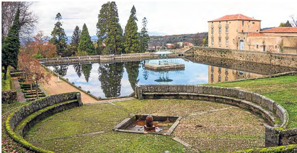
Vista general de la villa renacentista ducal de El Bosque, que se encuentra en un proceso de restauración.

Esta villa renacentista de recreo, ejemplo en toda Europa, fue declarada Jardín Histórico en el año 1946 y desde el año 1985 es también Bien de Interés Cultural