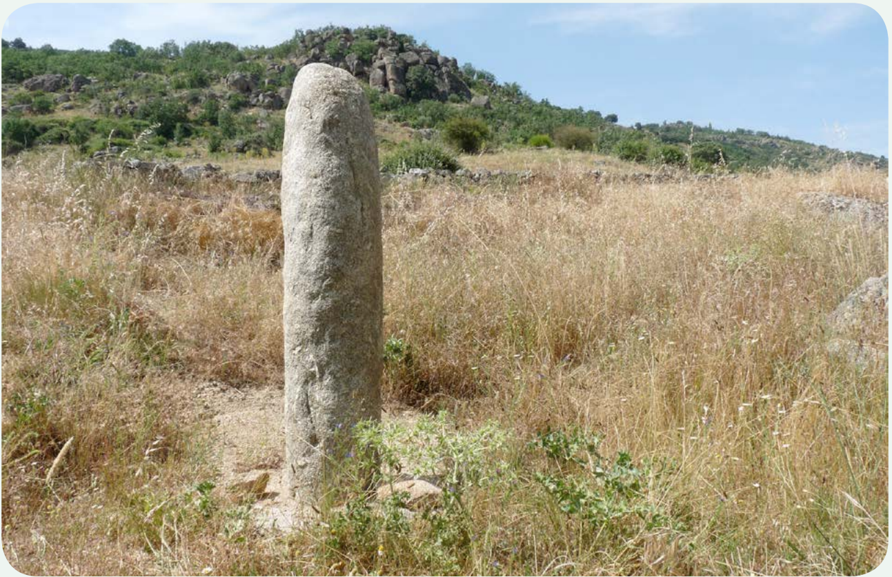
El miliario en la calzada (1). El miliario en la actualidad, una vez recuperado e instalado en el lugar de la vía donde se considera que pudo encontrarse la milla 136, cerca del lugar donde fue hallado en el cauce del río. Fotografía tomada desde el este.