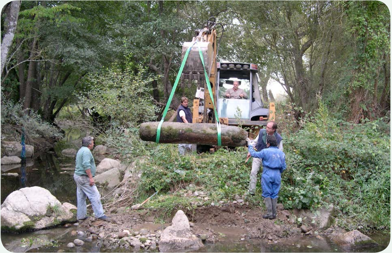
Recuperación, traslado e instalación en la calzada (2). Izado con la ayuda de una pala excavadora, una vez liberado del terreno.