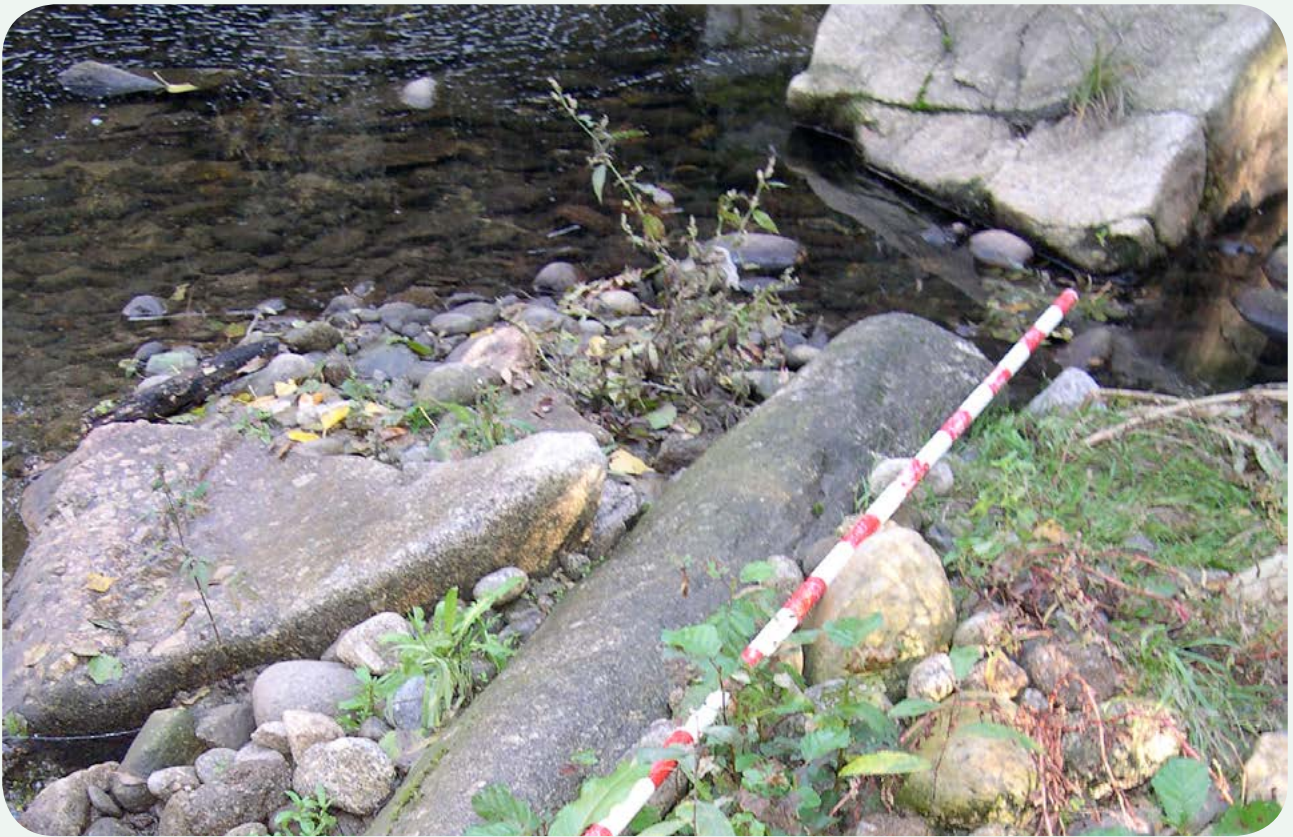
Localización anterior (2). Vista de detalle del miliario. Hasta hace poco tiempo había estado sumergido y resultaba casi imposible su observación o más aún su recuperación.