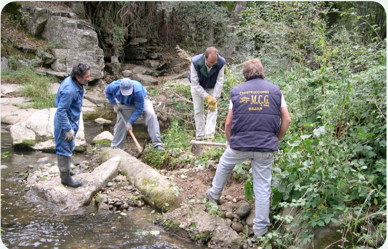
Recuperación, traslado e instalación en la calzada (1). Comienzo del proceso de recuperación del miliario, liberándolo de las arenas, gravas y piedras en las que se encontraba encajado (8 de octubre de 2008).