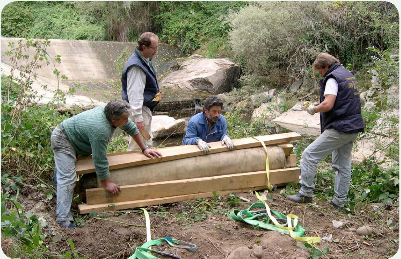
Recuperación, traslado e instalación en la calzada (3). Acondicionando el miliario para evitar daños en el transporte hasta la calzada. Primero se envuelve en una gruesa manta geotextil y a continuación se confecciona in situ un armazón de tabloncillos que se cinchan entre sí fuertemente.