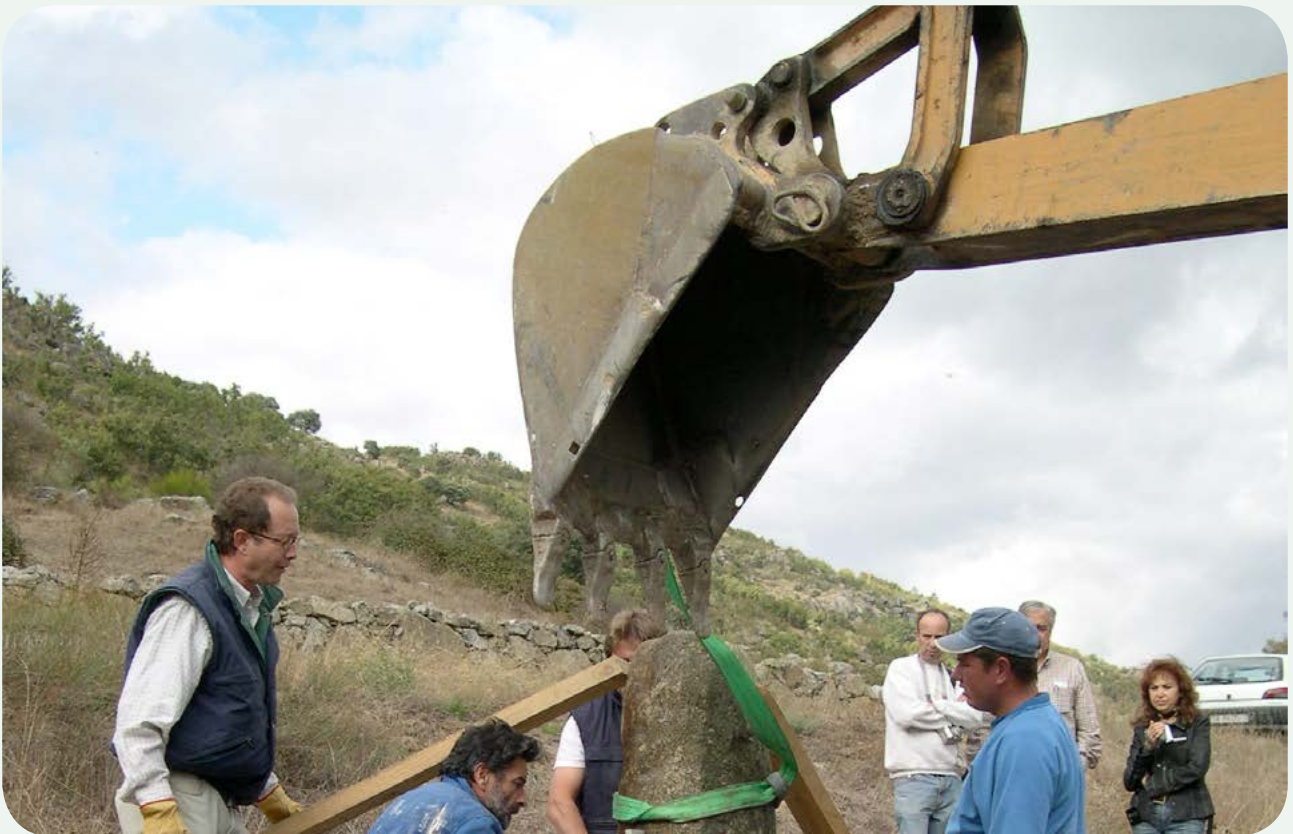
Recuperación, traslado e instalación en la calzada (7). Una última comprobación de aplomado antes de depositar el cemento en el hueco en el que se ha colocado la columna.