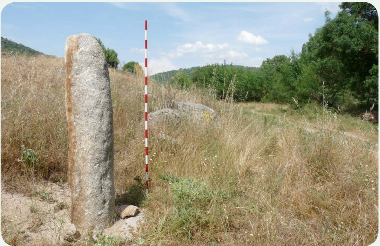
El miliario en la calzada (2). Otra vista de la columna miliaria desde el sur. A la derecha, la calzada, que se encamina un poco más adelante al caserío de la Colonia San Francisco.