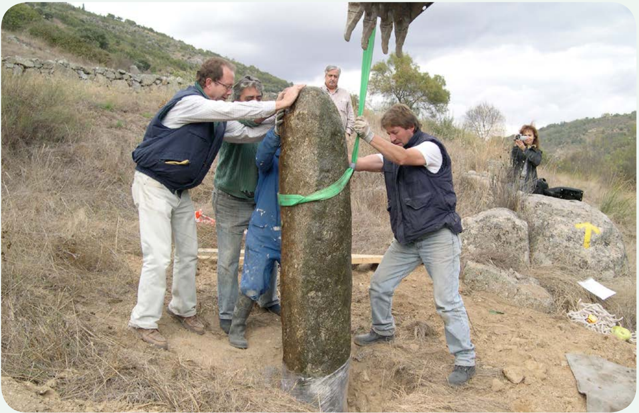
Recuperación, traslado e instalación en la calzada (6). Colocación del miliario en el hueco sobre el terreno realizado previamente, con ayuda de la pala excavadora. El siguiente paso consiste en calzarlo y aplomarlo, para evitar que oscile. Previamente, la base se ha protegido para que no entre en contacto con el cemento que rellenará seguidamente dicho hueco.