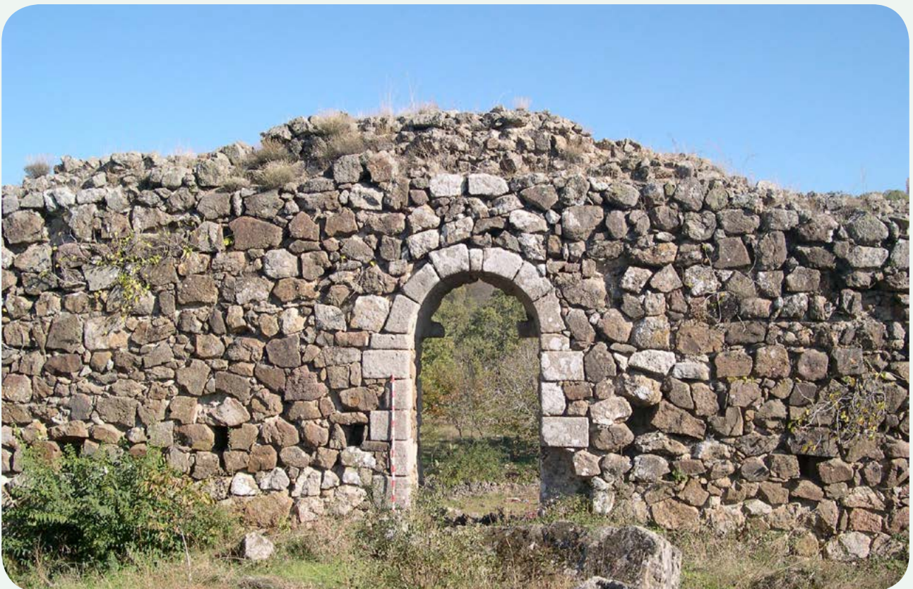
FORTÍN DE LA CALZADA (2). Vista del acceso desde el interior de la fortificación.