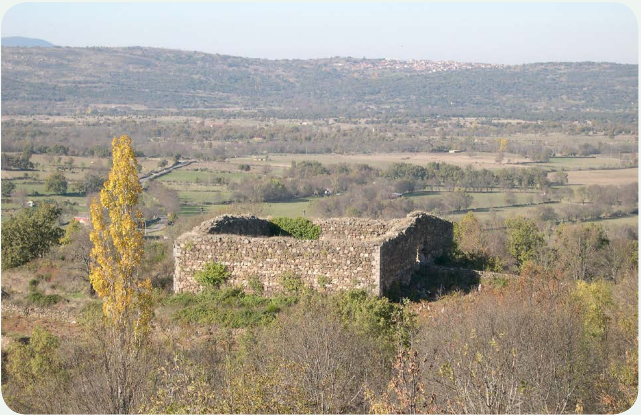
FORTÍN DE LA CALZADA (1). El llamado castillo o fortín de la calzada, al sureste de la población, dominando la Vía de la Plata, que discurre por el valle, visto desde la carretera Béjar-Ciudad Rodrigo. Se trata de una construcción que, comúnmente, se admite como de época romana, si bien sin datos concluyentes.