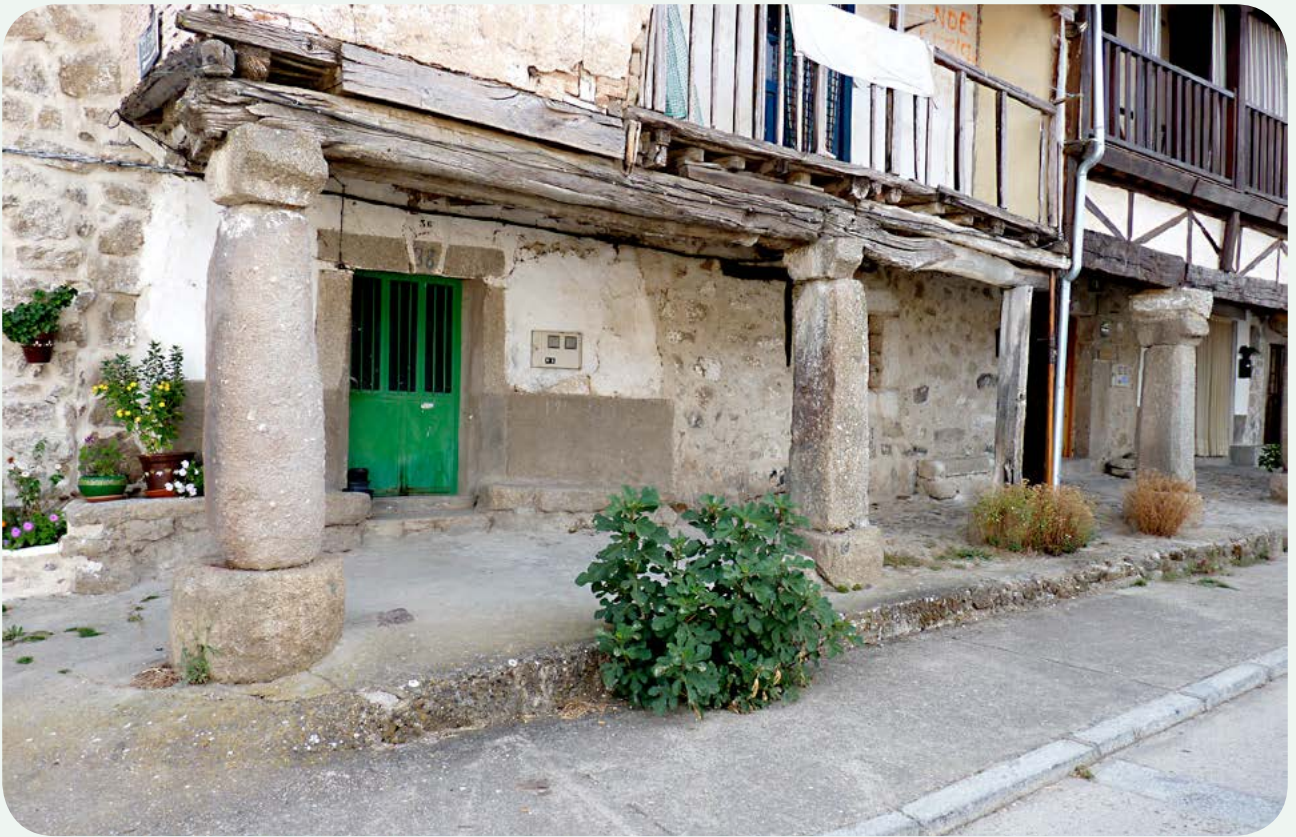
COLUMNA GRANÍTICA DE LA CALZADA DE BÉJAR (1). Balconada soportada por columnas y pilares en la población de La Calzada de Béjar, situada aproximadamente en la milla 138 de la Vía de la Plata.