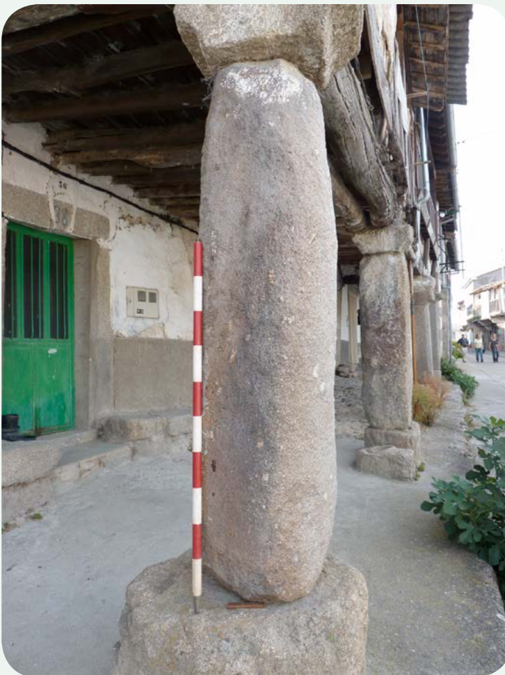
COLUMNA GRANÍTICA DE LA CALZADA DE BÉJAR (2). Detalle de la primera de las columnas, sin poder precisar que se trate del desaparecido miliario que señalaba la milla 138.