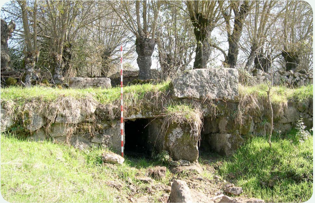
VISTA GENERAL DE LA ZONA (1). Alcantarilla visible en las cercanías de la finca de Vegones del Campillo, donde se encuentra el miliario, en el trazado de la calzada a la altura de la milla 139, que señalizaba este miliario.