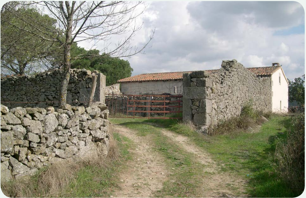
LOCALIZACIÓN ACTUAL (1). Zona de acceso a corral de la llamada Casa de los Vegones del Campillo o de los Prados Merinos, donde se encuentra el miliario, empotrado en un muro, apenas visible tras la cerca metálica roja.