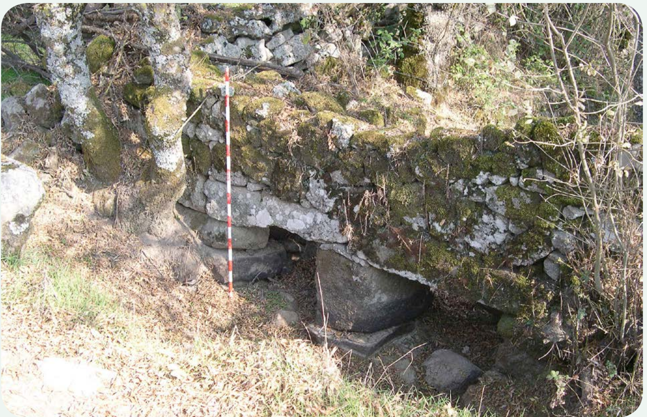
VISTA GENERAL DE LA ZONA (2). Otro paso de aguas cerca de la anterior. Estas construcciones parecen ser de la Edad Moderna, si bien originariamente pudieron ser romanas.