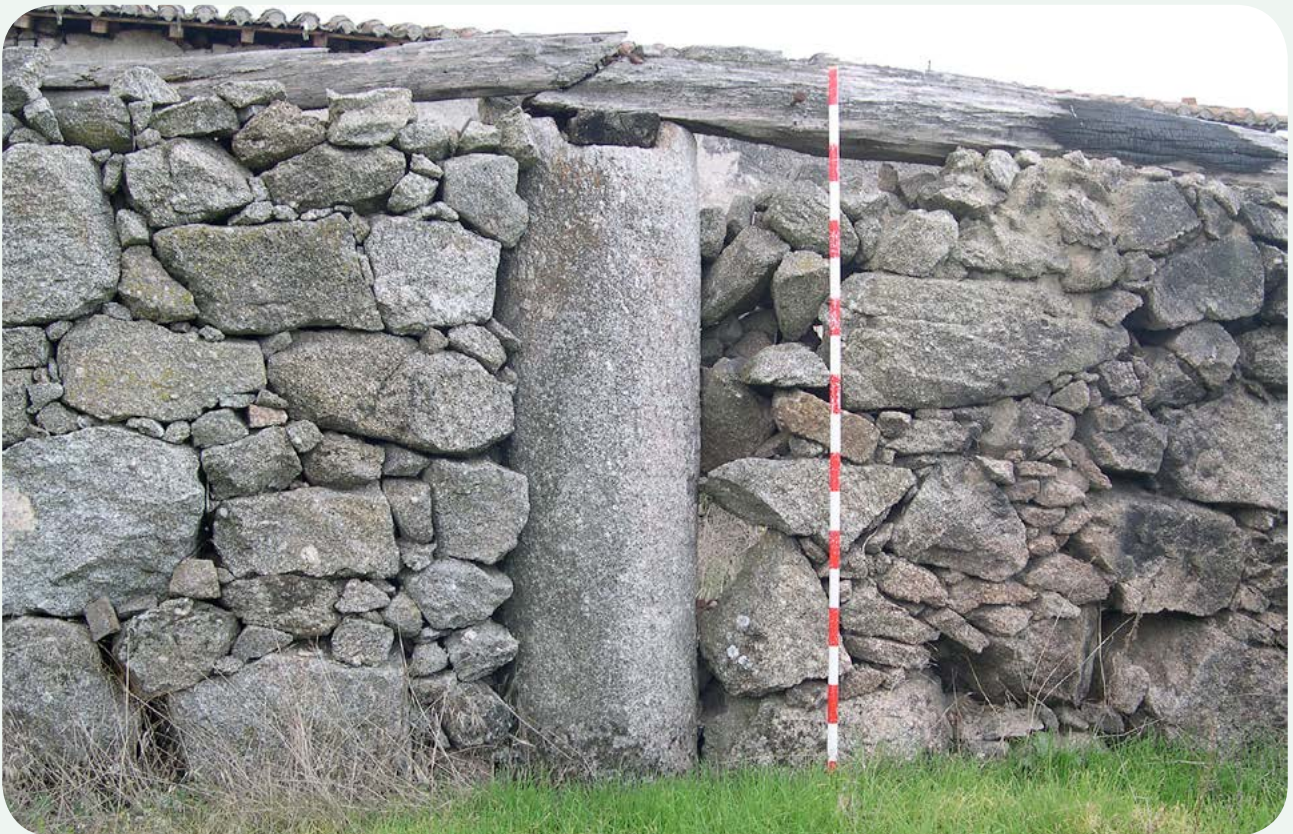
LOCALIZACIÓN ACTUAL (2). El miliario integrado en el muro, haciendo las veces de puntal. El plano superior fue rebajado para servir de asiento a las vigas de la techumbre.