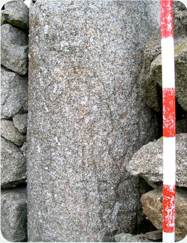
LOCALIZACIÓN ACTUAL (5). Vista parcial de la epigrafía, bien legible, con numeral CXXXIX.