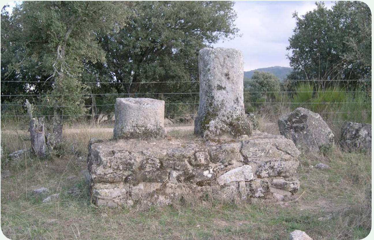
EL MILIARIO EN LA CALZADA (1). Vista general desde el interior de la finca La Ollera de los dos fragmentos de miliarios instalados sobre un amplio pedestal junto a la calzada, a la altura de la milla 141.