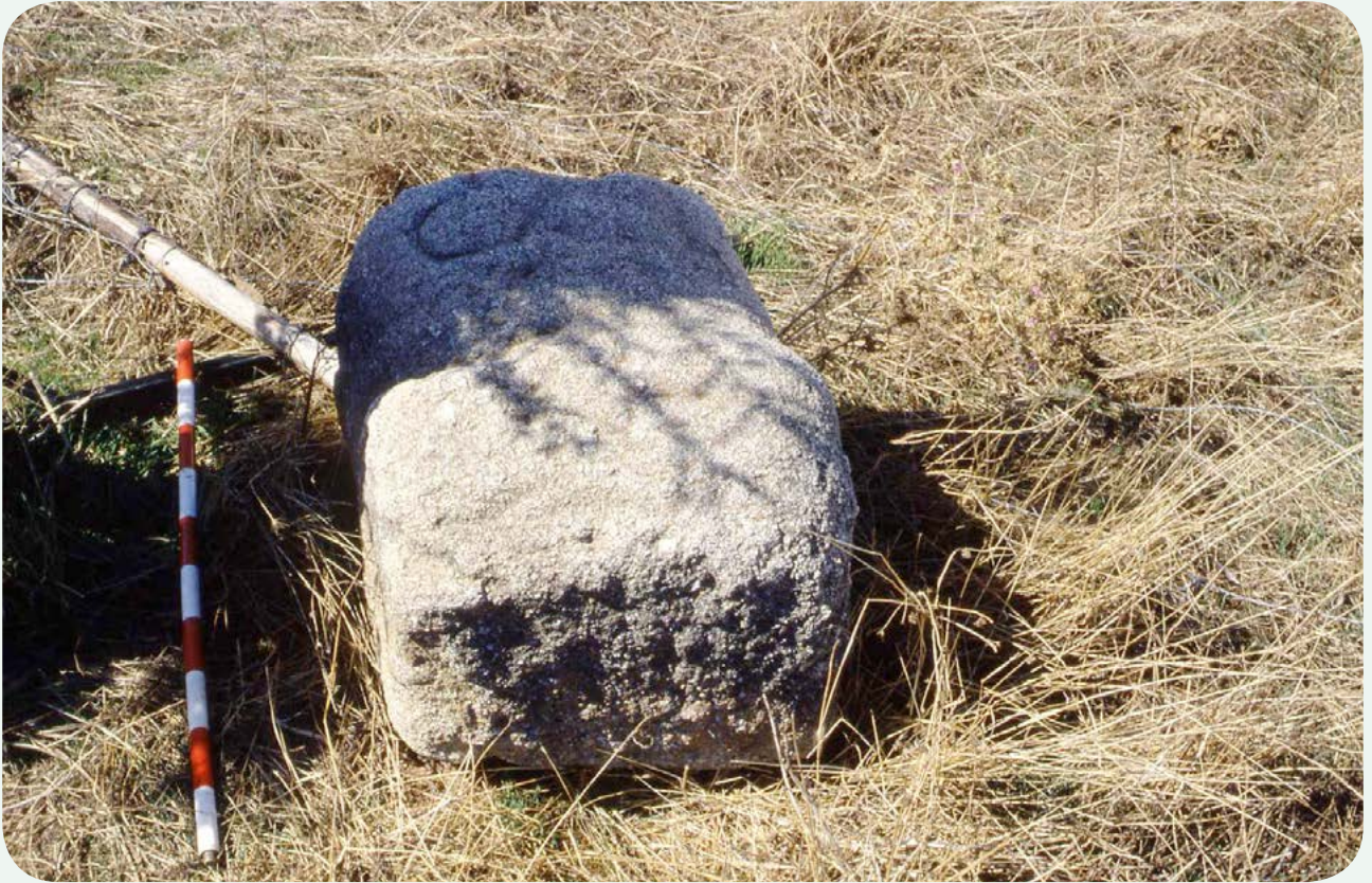
LOCALIZACIÓN ANTERIOR. El miliario en el interior de la finca La Ollera, antes de su traslado a la calzada (Fotografía Asociación de Amigos del Museo de Salamanca, carr828-15).