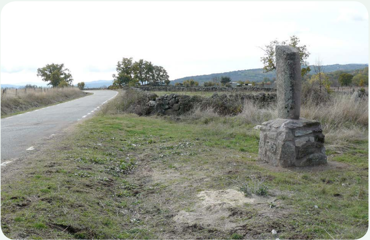
EL MILIARIO EN LA CALZADA (1). El miliario finalmente instalado en el paraje conocido como Fuente del Cura o del Fraile, en la carretera de Valverde de Valdelacasa a Valdelacasa, a 1,5 kilómetros aproximadamente -una milla romana en dirección norte- de la población donde se encontraba.