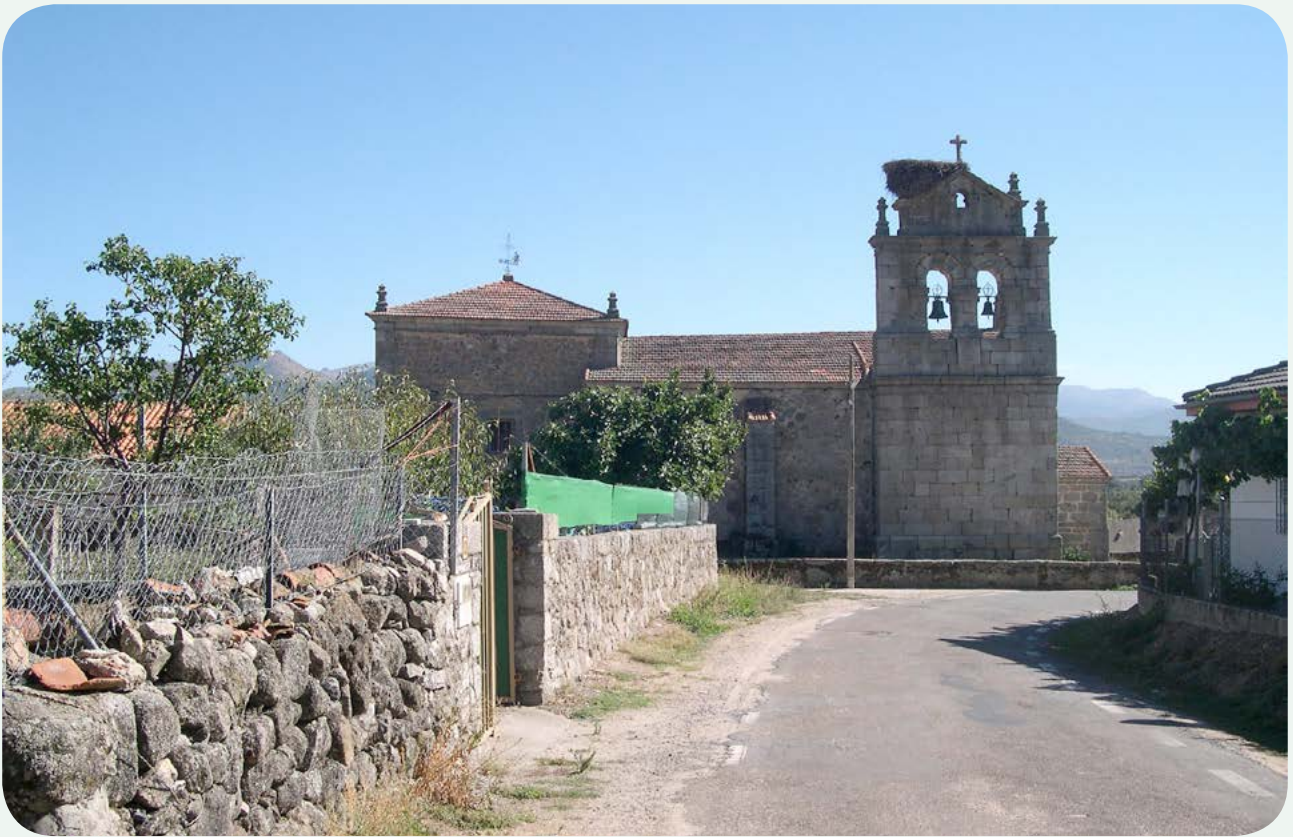
LOCALIZACIÓN ANTERIOR (1). Acceso a la propiedad de la Calle Campana nº 13 (a la izquierda), en Valverde de Valdelacasa, donde se encontraba el miliario.