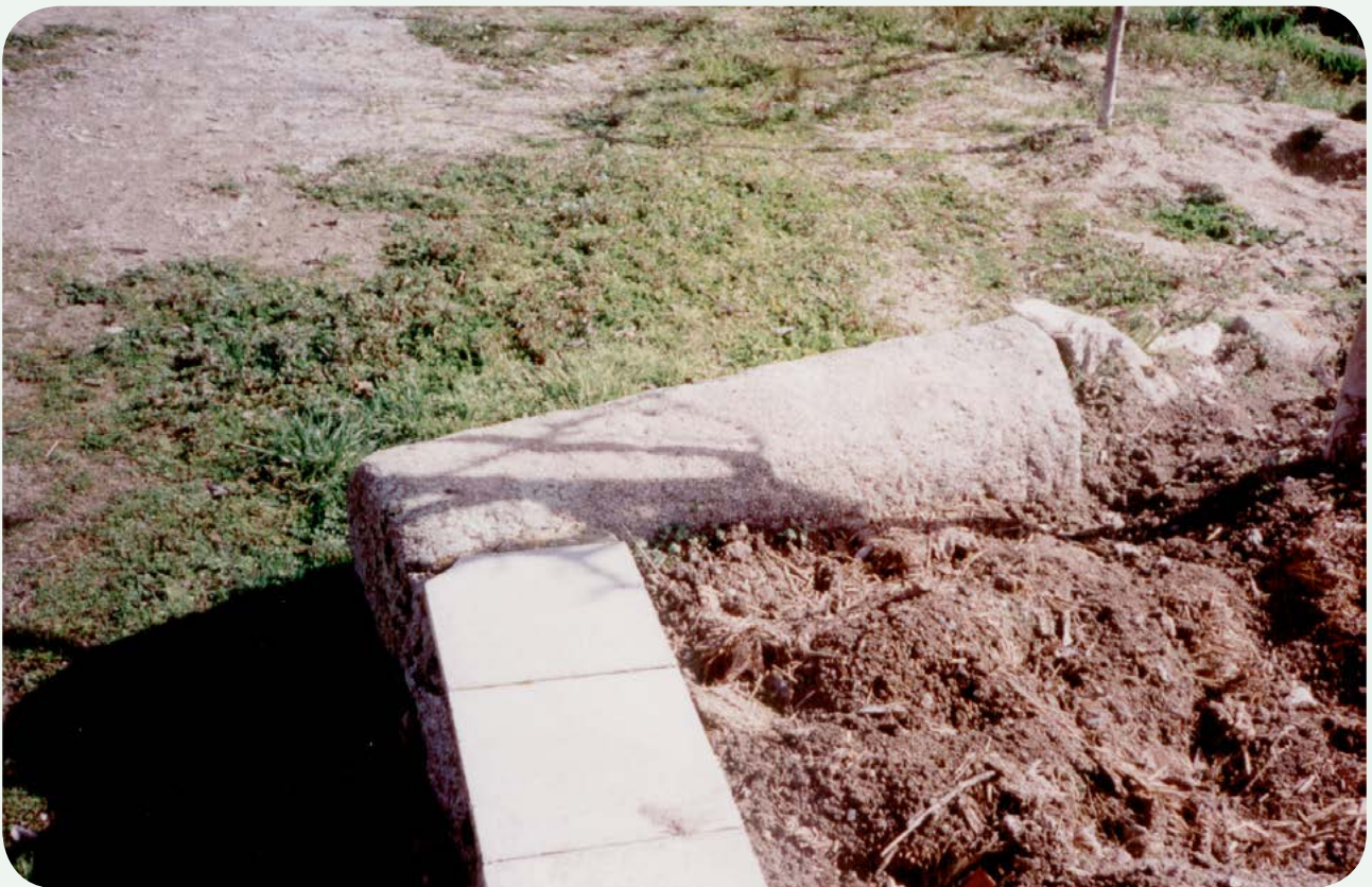
LOCALIZACIÓN ANTERIOR (2). El miliario recién colocado en el jardín, en una fotografía de Enríquez (1993).