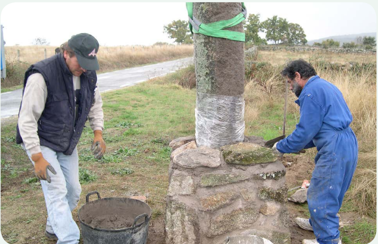
RECUPERACIÓN, TRASLADO E INSTALACIÓN EN LA CALZADA (5). Realización del tejadillo del pedestal, una vez colocado y aplomado el miliario, previamente protegido para evitar el contacto del granito con el cemento.