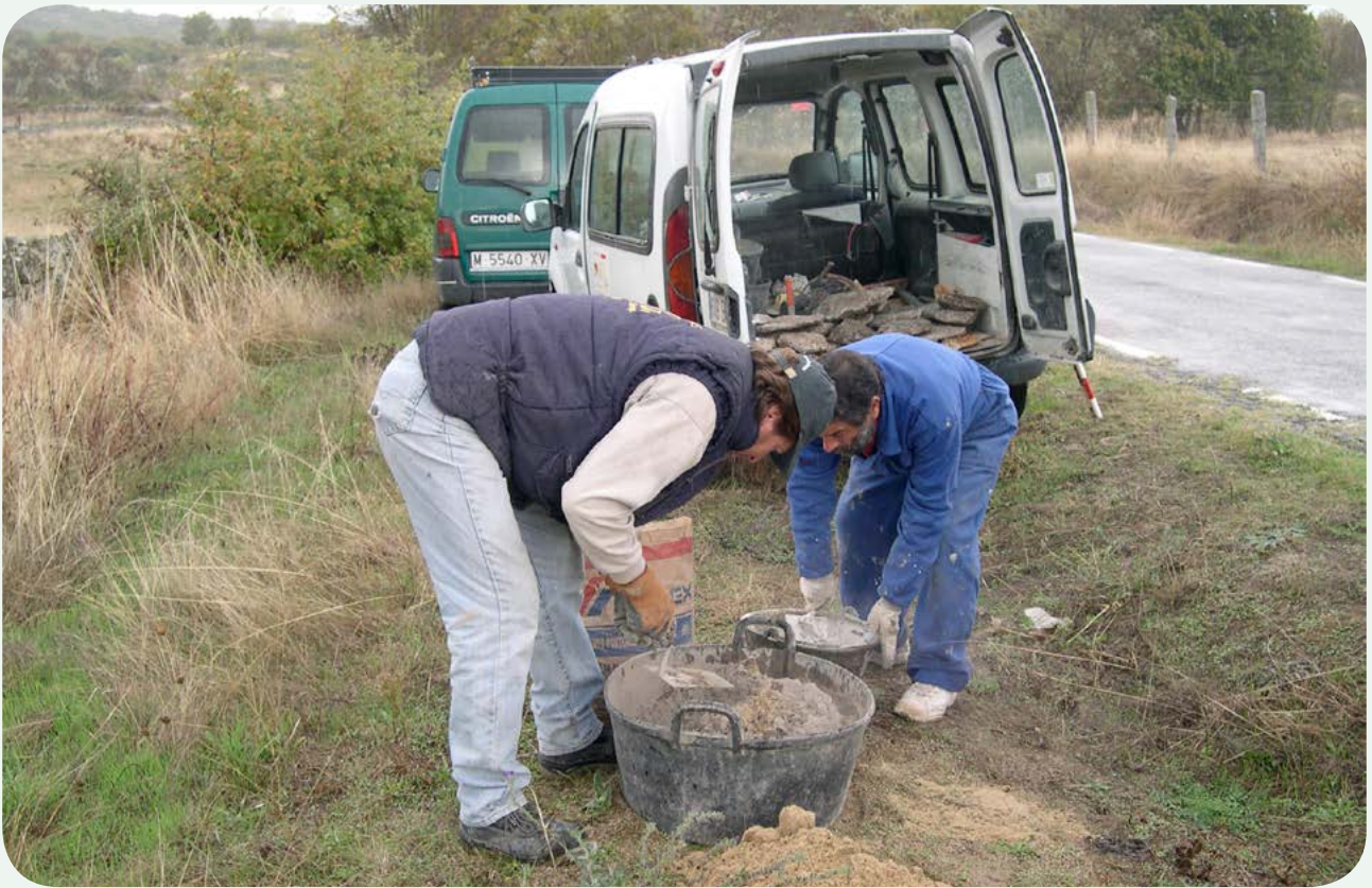
RECUPERACIÓN, TRASLADO E INSTALACIÓN EN LA CALZADA (4). Preparando la masa de cemento para sujetar el miliario y rematar el tejadillo del pedestal.