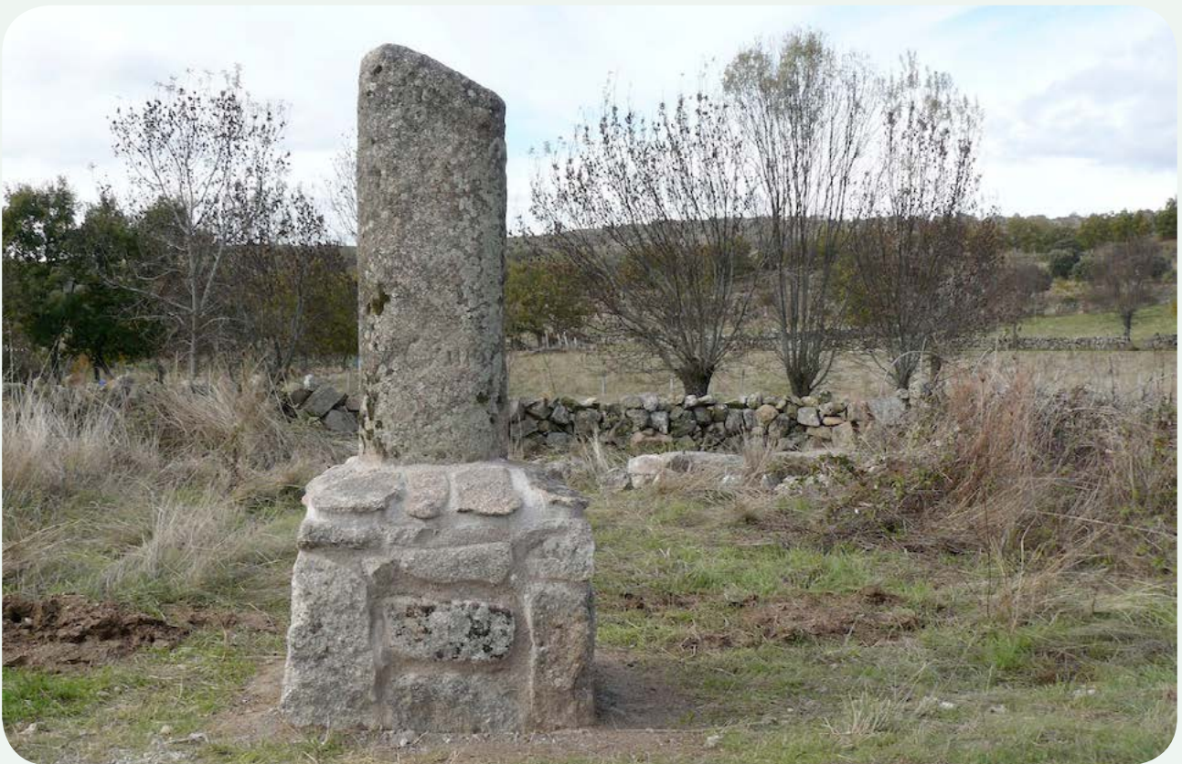
EL MILIARIO EN LA CALZADA (2). Vista frontal del miliario colocado sobre el pedestal.