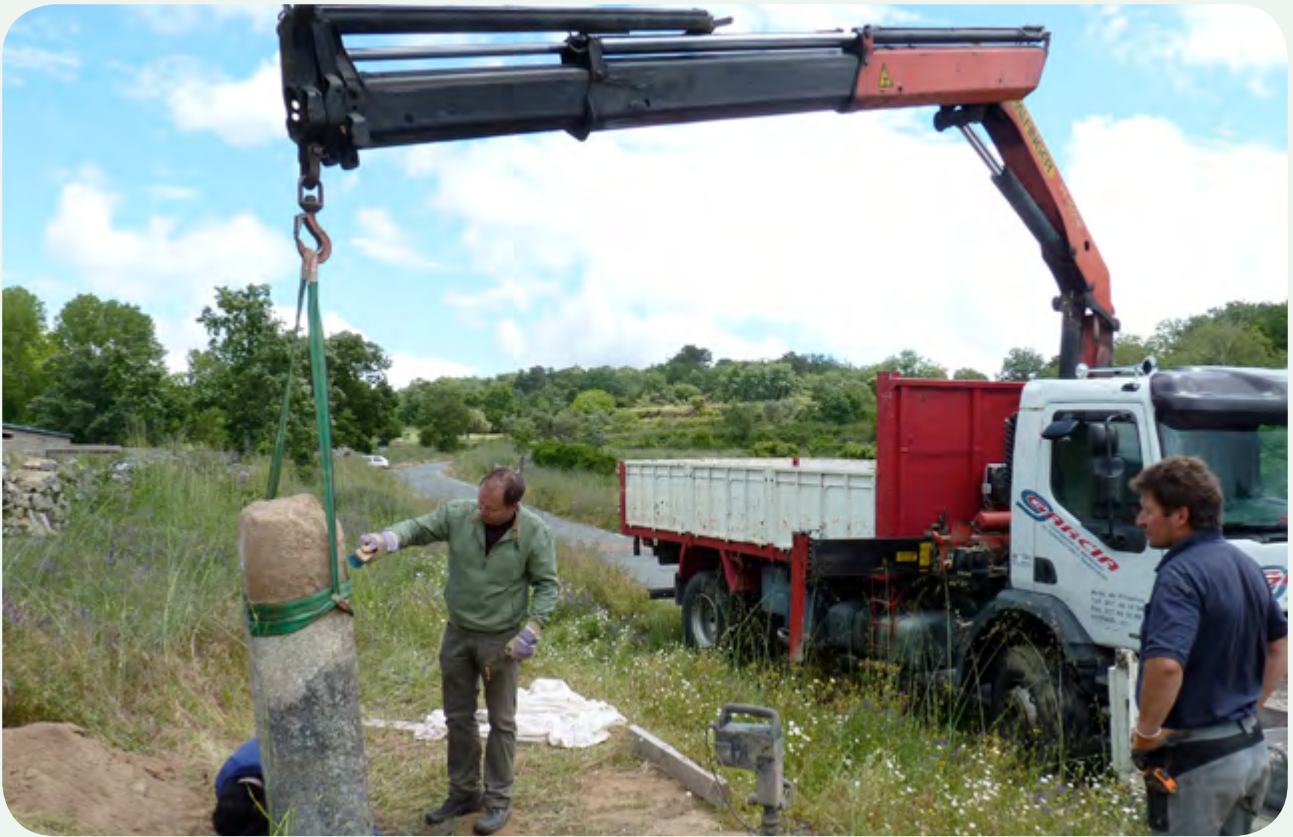
RECUPERACIÓN, COLOCACIÓN DE RÉPLICA, TRASLADO E INSTALACIÓN EN LA CALZADA (6). Traslado del miliario e instalación en el tramo incoado de la Vía de la Plata, en un lateral de la carretera de Valverde de Valdelacasa a Valdelacasa.