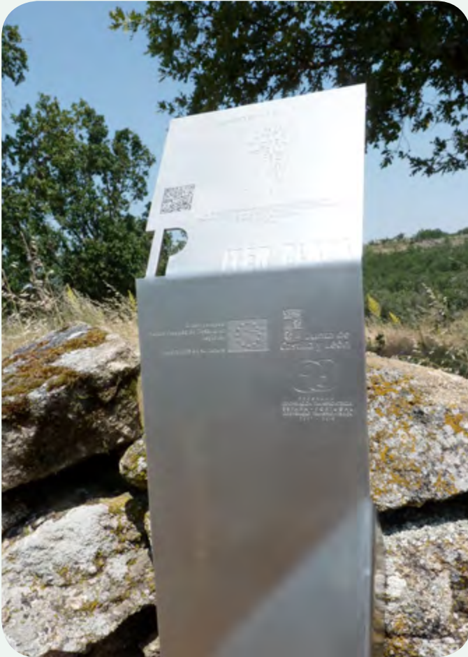
EL MILIARIO INSTALADO EN LA CALZADA (5). Vista trasera, apreciándose la superficie reconstruida.