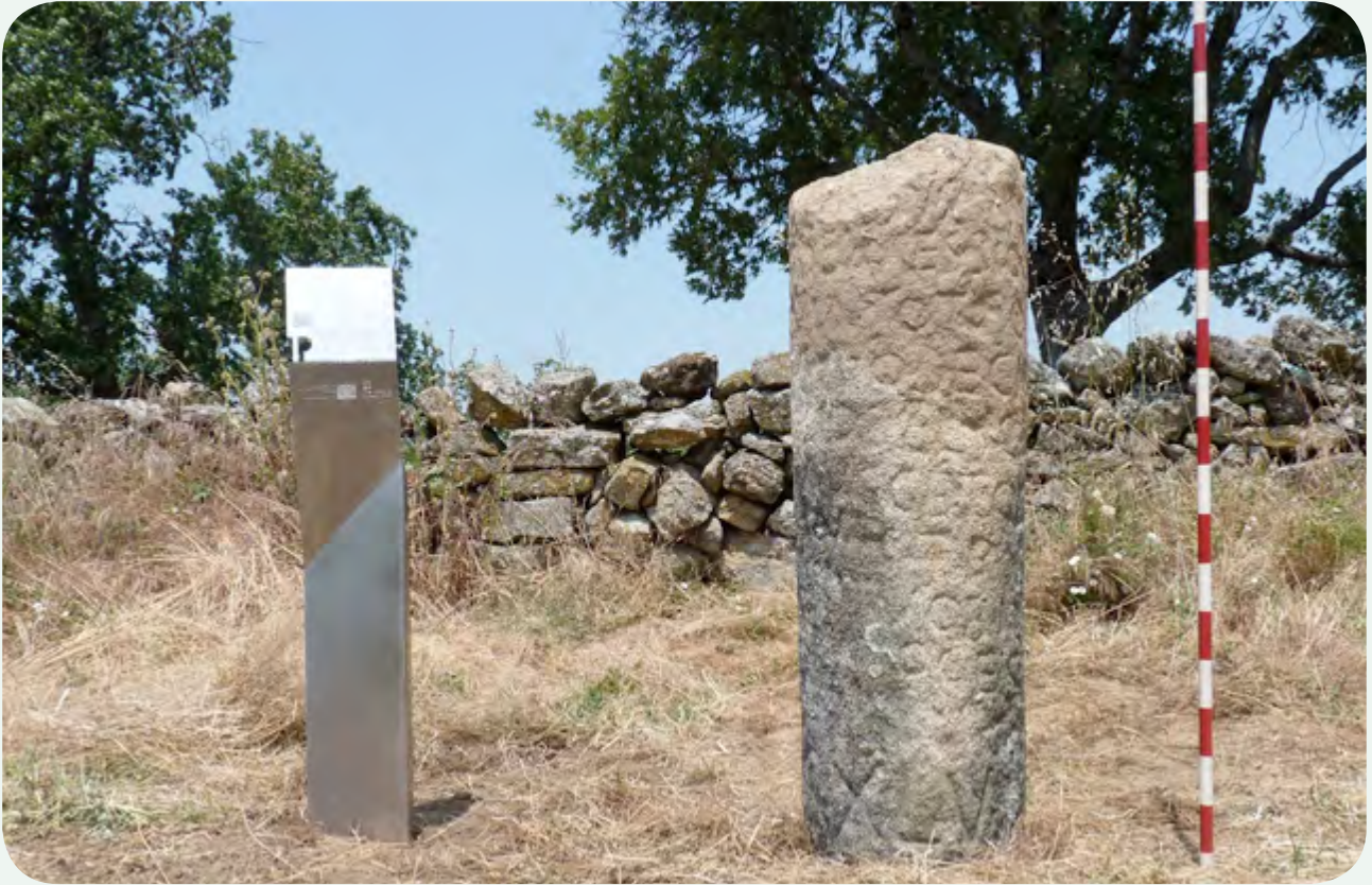
EL MILIARIO INSTALADO EN LA CALZADA (1). El miliario una vez señalado, en la milla 145 de la Vía de la Plata.