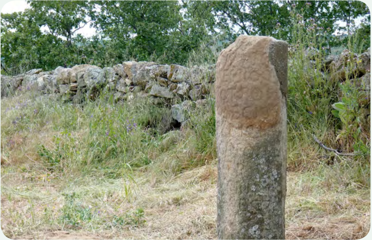
RECUPERACIÓN, COLOCACIÓN DE RÉPLICA, TRASLADO E INSTALACIÓN EN LA CALZADA (10). El miliario una vez instalado en la calzada, a la altura de la milla 145 de la Vía de la Plata, antes de colocar la señal.