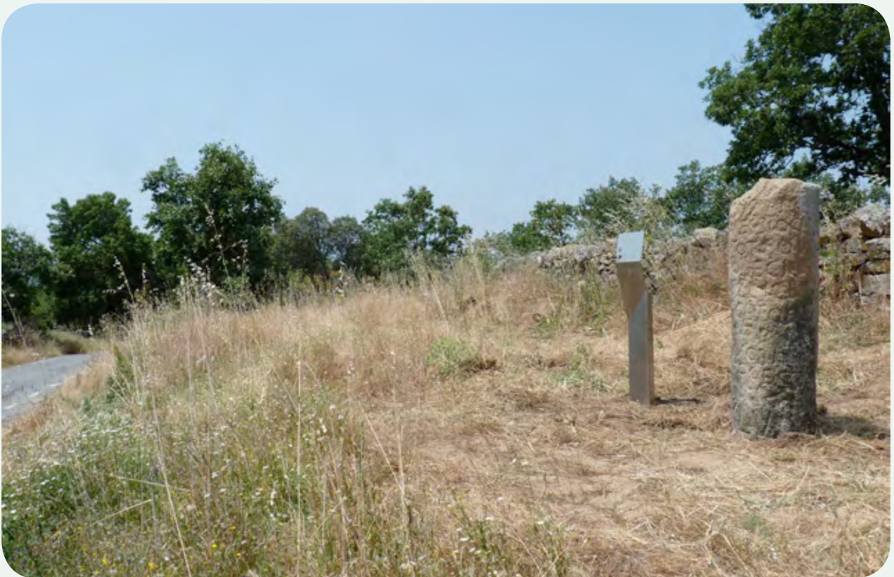
EL MILIARIO INSTALADO EN LA CALZADA (6). Vista general. A la izquierda discurre la carretera que comunica Valdelacasa con Valverde de Valdelacasa. El miliario se encuentra instalado a unos tres kilómetros (dos millas romanas) antes de llegar a la segunda población.