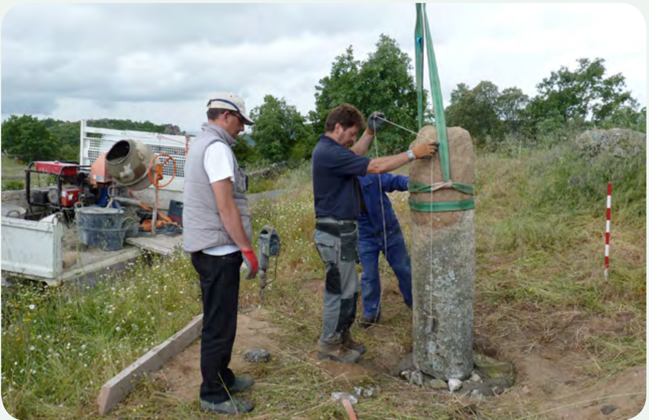
RECUPERACIÓN, COLOCACIÓN DE RÉPLICA, TRASLADO E INSTALACIÓN EN LA CALZADA (7). Aplomando la columna miliaria antes de su definitiva instalación.