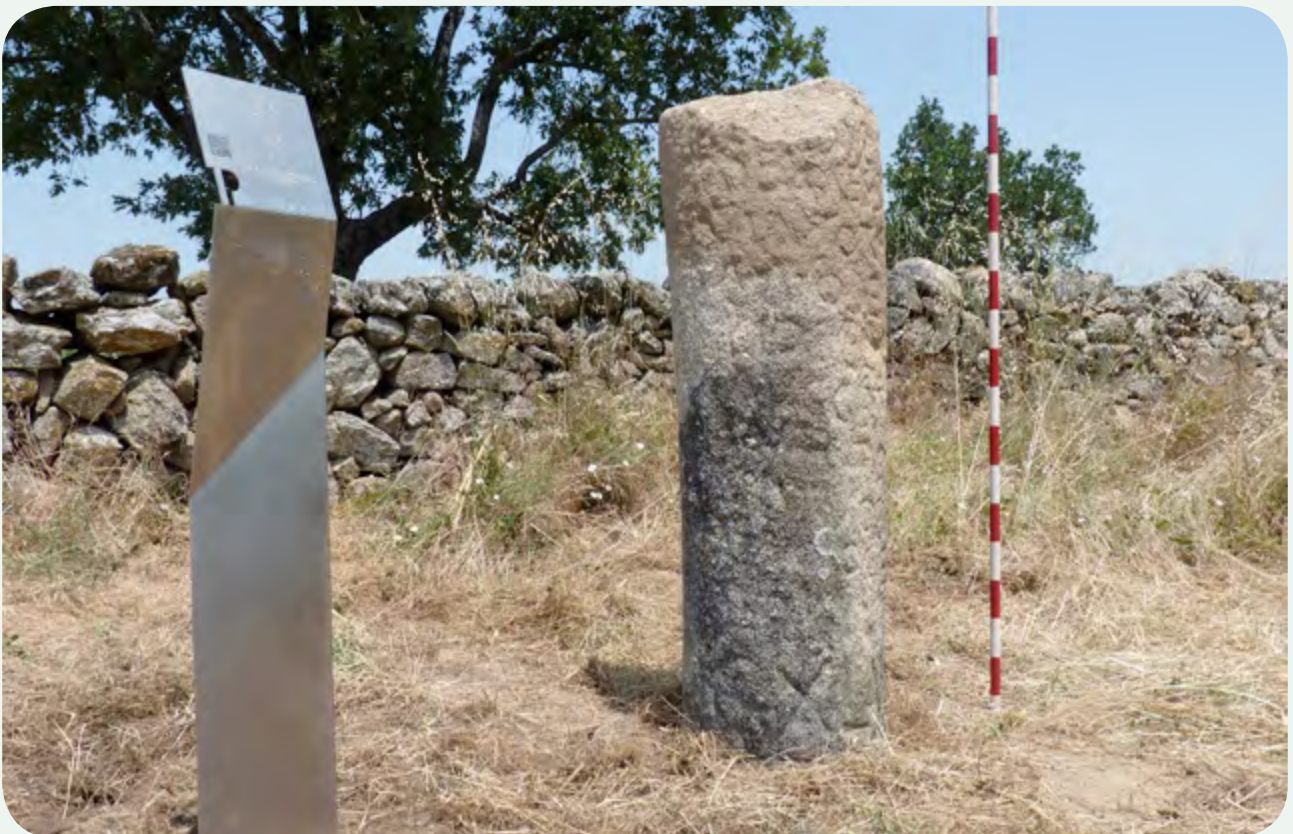
EL MILIARIO INSTALADO EN LA CALZADA (1). Otra vista del miliario.