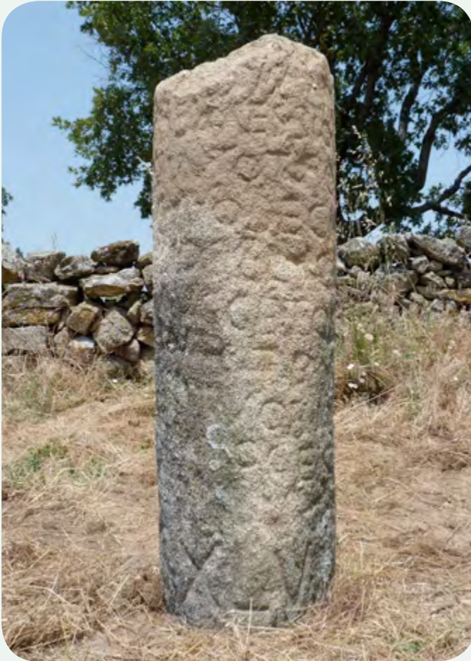
EL MILIARIO INSTALADO EN LA CALZADA (3). Detalle de la bien conservada y extensa epigrafía, observándose a la perfección la milla: CXLV.