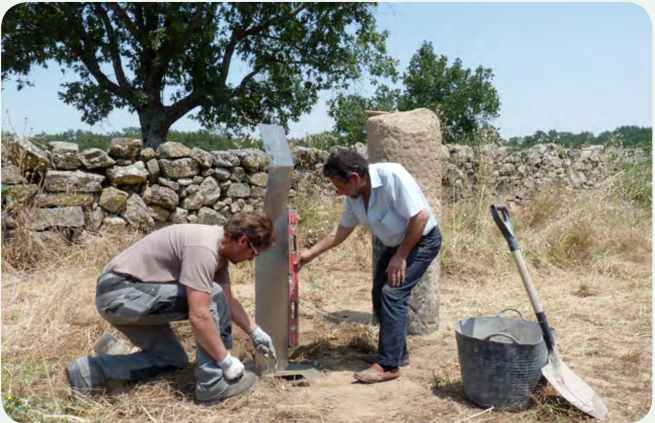
RECUPERACIÓN, COLOCACIÓN DE RÉPLICA, TRASLADO E INSTALACIÓN EN LA CALZADA (11). Instalando la señal ITER PLATA.