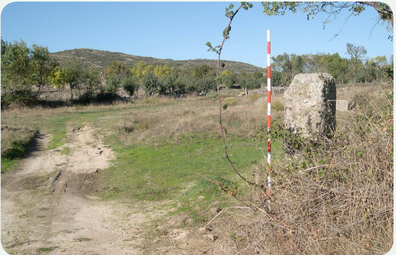
LOCALIZACIÓN ACTUAL (4). El miliario parcialmente visible, según se accede por la cañada en dirección norte.