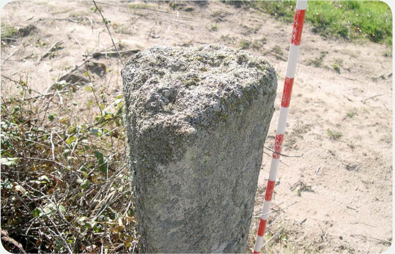
LOCALIZACIÓN ACTUAL (3). Vista superior de la pieza, que se encuentra cortada longitudinalmente, contando con sección triangular.