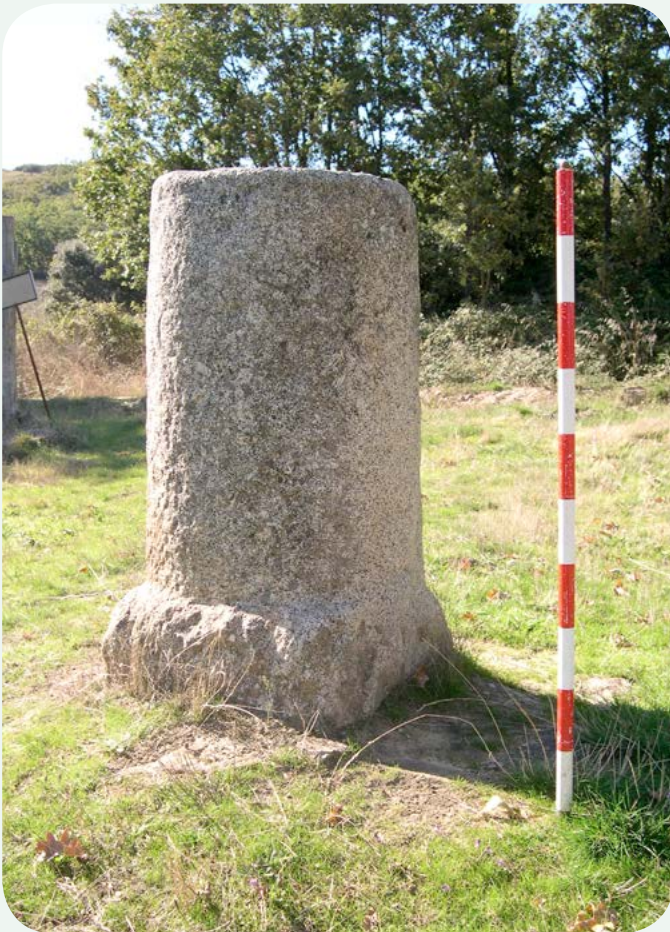
EL MILIARIO EN LA CALZADA (3). Otra vista del miliario.