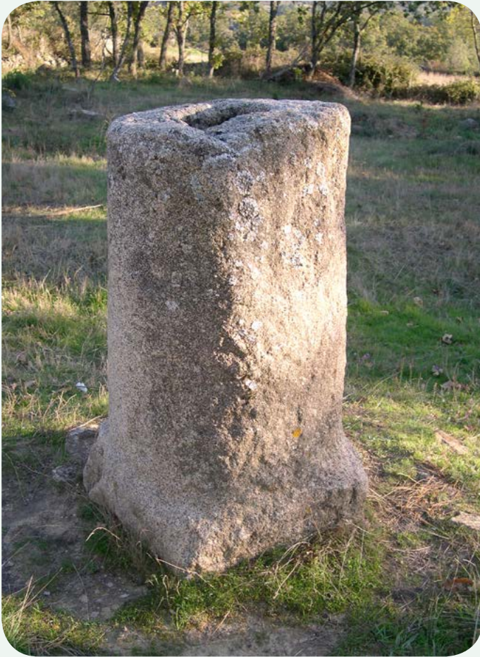
EL MILIARIO EN LA CALZADA (2). Otra vista de esta base de columna miliaria 31, en la milla 148 de la Vía, recolocada por iniciativa de ACASAN. Se observa la perforación superior.