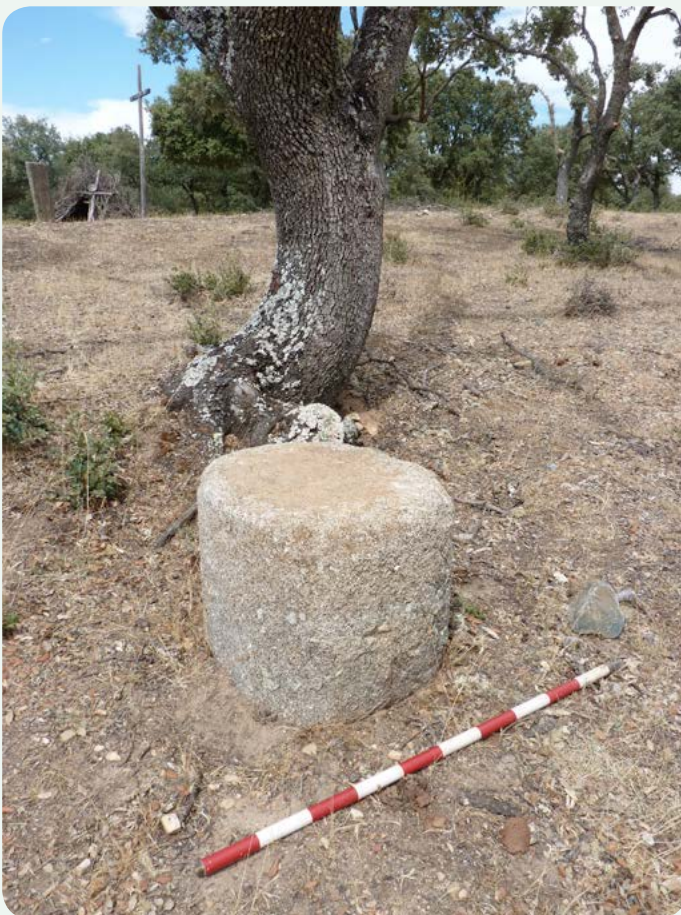
LOCALIZACIÓN ACTUAL (2). Fragmento miliario 37, entre las millas 154 y 155.