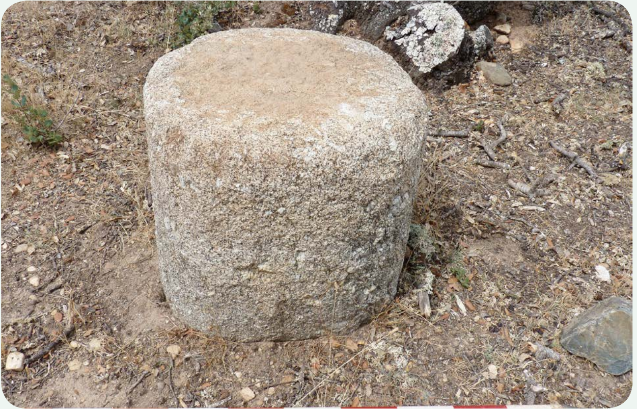
LOCALIZACIÓN ACTUAL (3). Vista de detalle del fragmento, posiblemente perteneciente a un miliario.