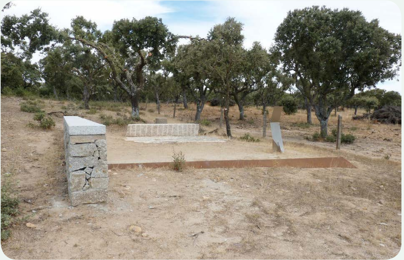
LOCALIZACIÓN ACTUAL (1). Mirador entre las dos millas, levantado en el verano de 2011, en el transcurso de la ejecución de la señalización del tramo. El posible pequeño fragmento de miliario asoma al fondo detrás del bloque rectangular de granito en bruto, una vez retirado del cilindro sobre el que estaba colocado.