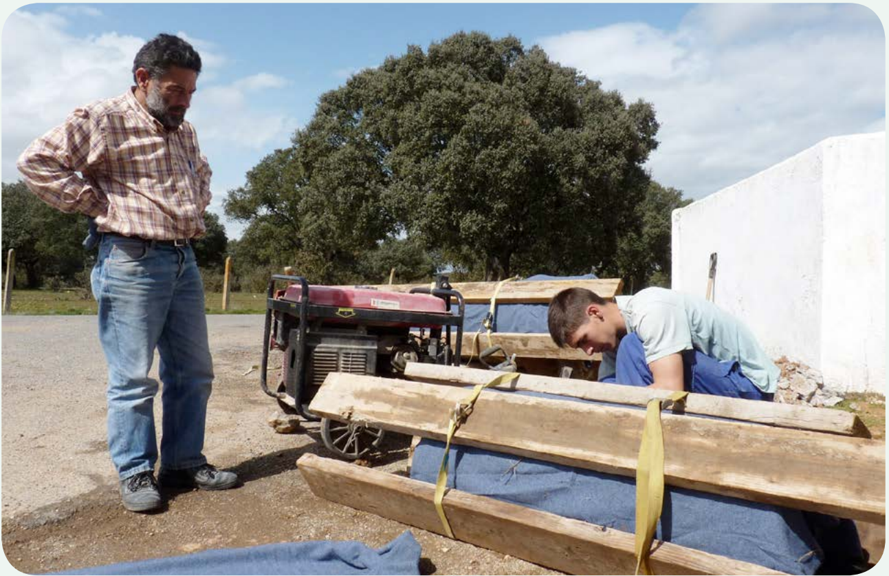
RECUPERACIÓN, TRASLADO E INSTALACIÓN EN LA CALZADA (2). La pequeña columna miliaria es envuelta en una manta gruesa, rodeada de tablones y cinchada fuertemente, para evitar desplazamientos o deterioros durante el traslado a su nueva ubicación cerca de la calzada romana.