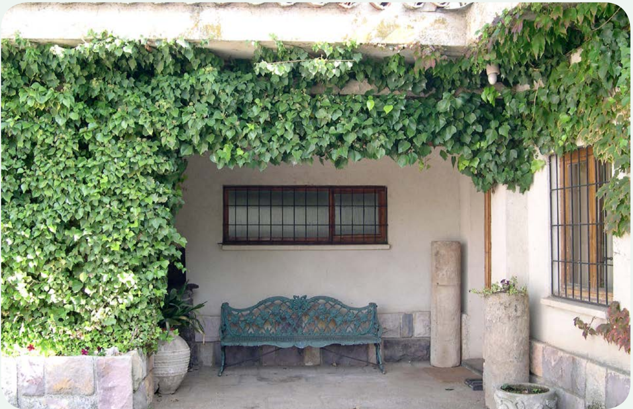
LOCALIZACIÓN ANTERIOR (2). El miliario de Linejo 3, en el porche de la finca, en primer plano a la derecha. Fotografía tomada en 2007 a raíz del estudio técnico de reposición de los miliarios de la Vía de la Plata en la provincia de Salamanca (Jiménez González y otros, 2007).