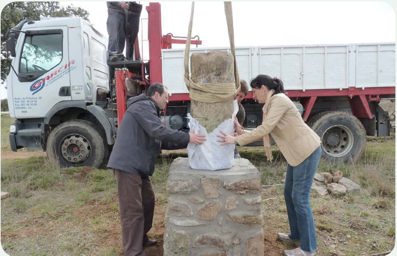
TRASLADO E INSTALACIÓN EN LA CALZADA (3). Momento de la descarga sobre el pedestal y protección mediante malla geotextil de la base del miliario que estará en contacto con el cemento, con la improvisada colaboración del arqueólogo del Servicio Territorial de Cultura de la Junta de Castilla y León y la directora del albergue de peregrinos de San Pedro de Rozados.