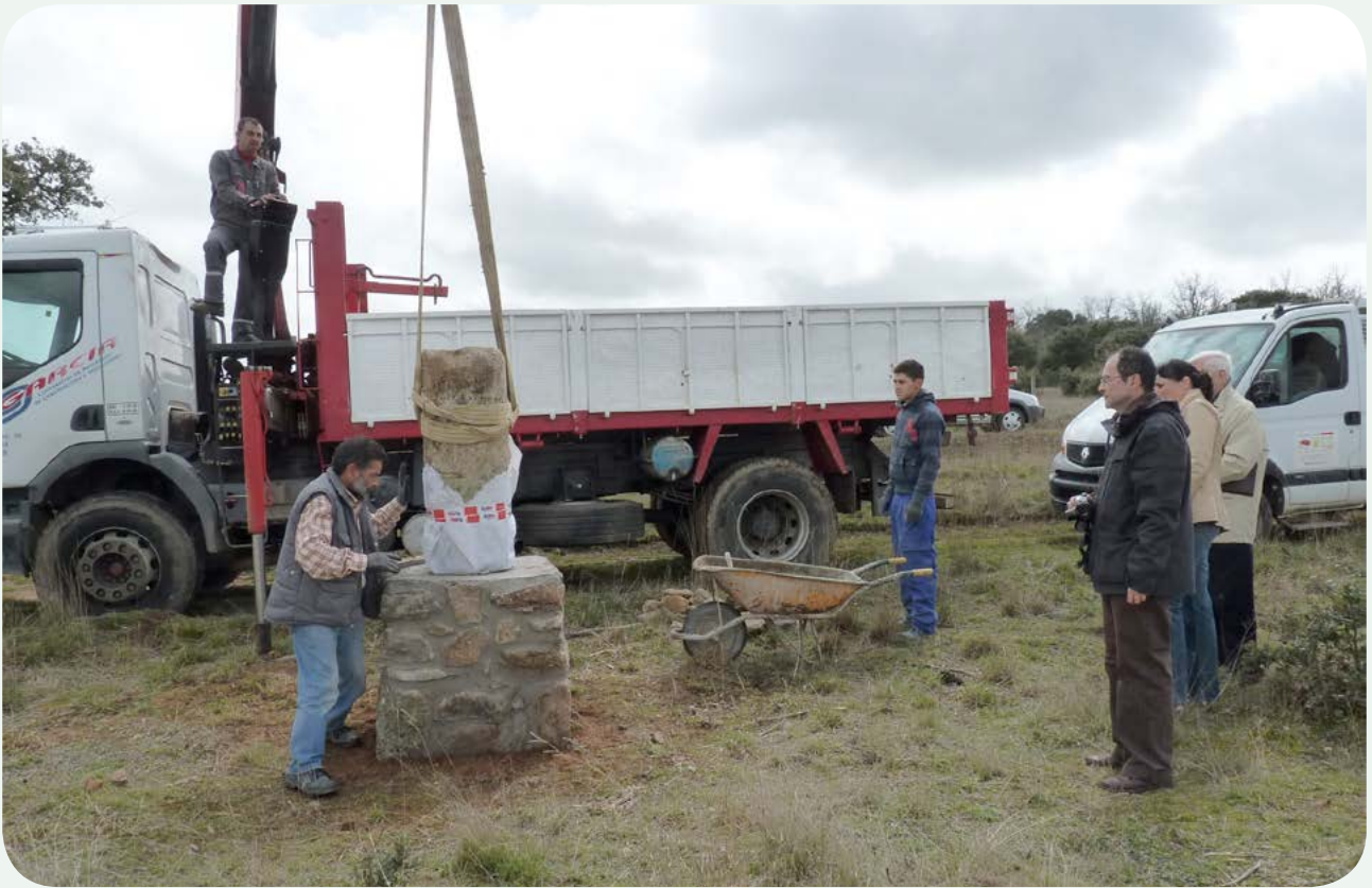
RECUPERACIÓN, TRASLADO E INSTALACIÓN EN LA CALZADA (4). Asentando y aplomando la columna, como paso previo al remate del tejadillo del pedestal.