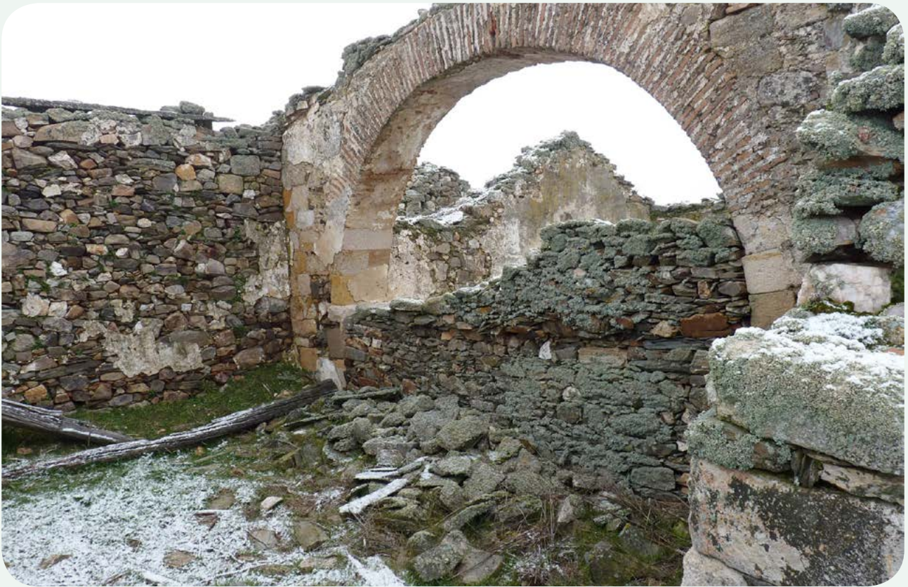
LOCALIZACIÓN ANTERIOR (1). Ruinas de la ermita de Calzadilla de Méndigos, cerca del caserío, donde se encontraban estos miliarios desde tiempos inmemoriales, siendo trasladados en los años '70 a la finca Linejo, en Matilla de los Caños del Río.