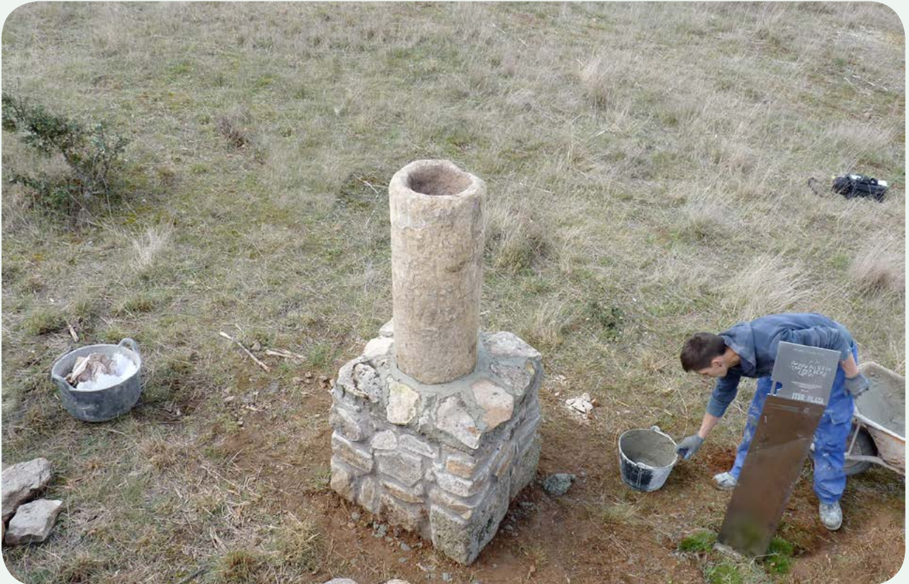
TRASLADO E INSTALACIÓN EN LA CALZADA (5). Vista superior de la columna, una vez instalada la señal ITER PLATA al lado. Se aprecia la oquedad relacionada con su reutilización como pila bautismal en la ermita.