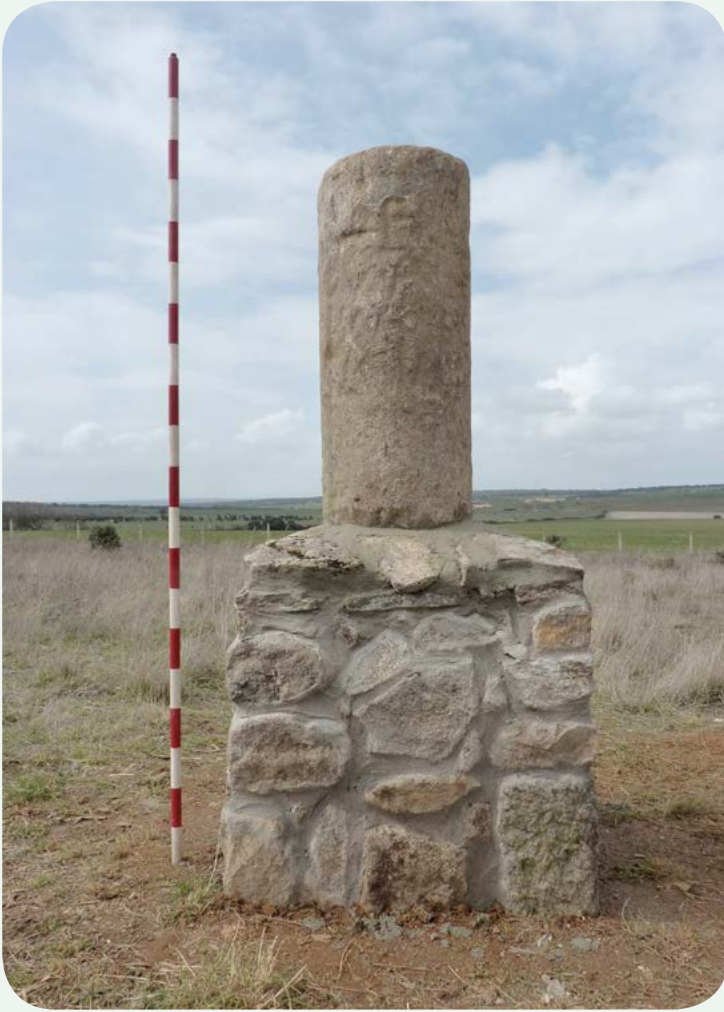
EL MILIARIO EN LA CALZADA (3) Vista de la columna miliaria, en la que se aprecia la deteriorada inscripción.