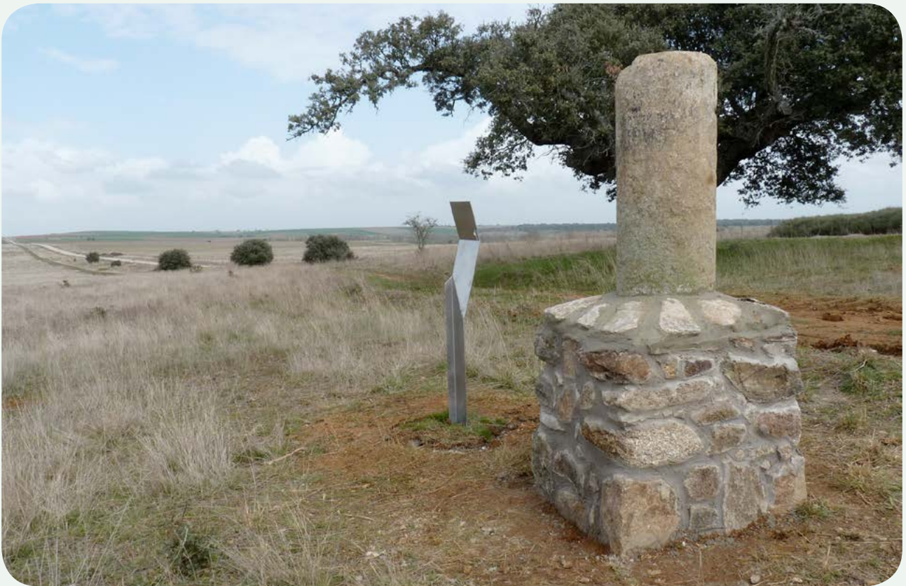
EL MILIARIO EN LA CALZADA (2). Otra vista de esta columna miliaria fragmentada. A la derecha se observa el actual camino que discurre paralelo a la carretera.