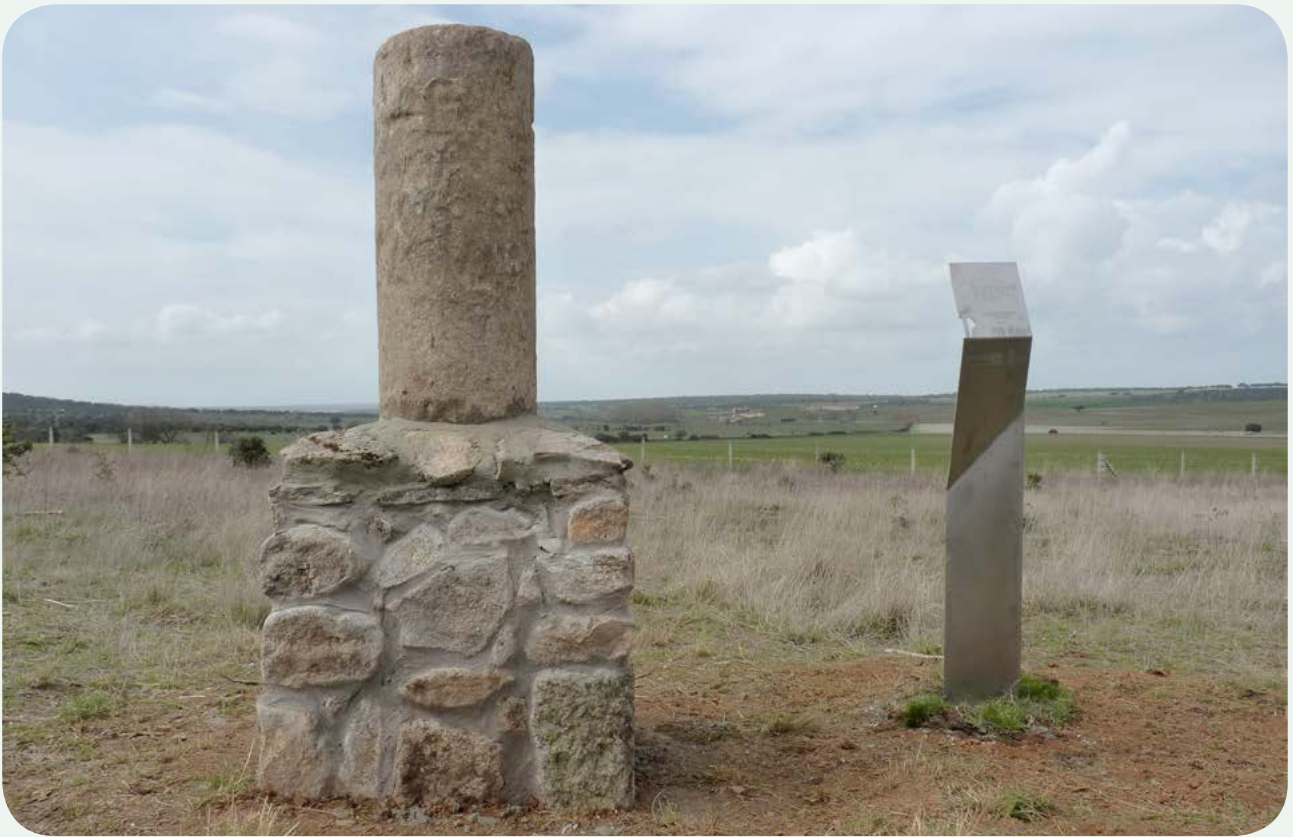
EL MILIARIO EN LA CALZADA (1). El miliario una vez instalado sobre el pedestal, en la amplia cañada, con la señal correspondiente, aproximadamente a la altura de la milla 166 de la Vía de la Plata.