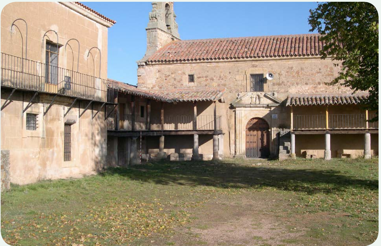
LOCALIZACIÓN ACTUAL (2). Soportales en el acceso a la ermita, convertido en ocasiones en improvisada plaza de toros. El miliario se encuentra en la parte inferior izquierda, sosteniendo el entramado de madera del primer piso, a modo de columna.