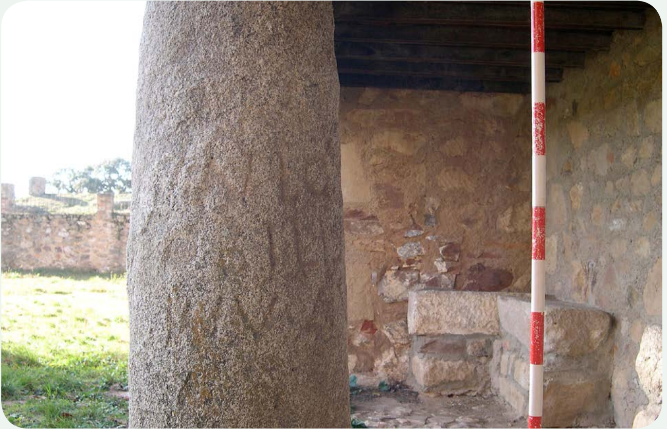
LOCALIZACIÓN ACTUAL (5). Detalle de la inscripción latina, que carece de numeral.