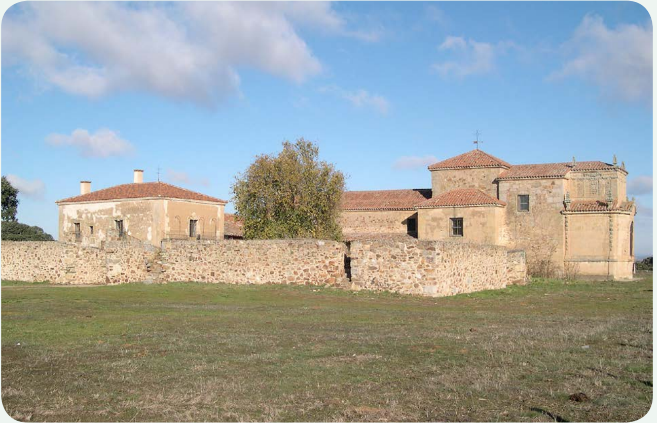
LOCALIZACIÓN ACTUAL (1). Vista general de la ermita de la Virgen del Cueto.