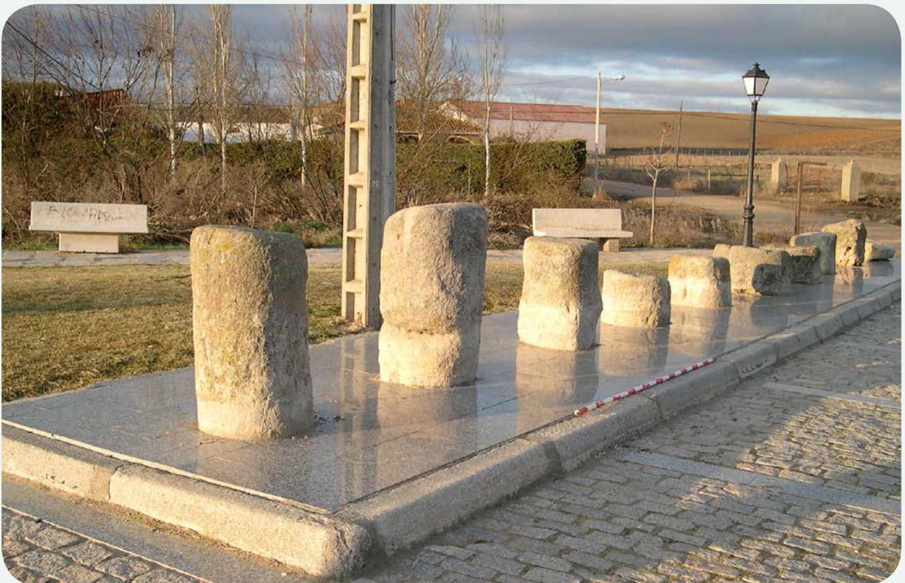
LOS IMPROBABLES MILIARIOS EN LA CALZADA. Los fragmentos después del traslado a su ubicación actual en las afueras del casco urbano, por donde discurre la calzada (fotografía tomada en 2007).