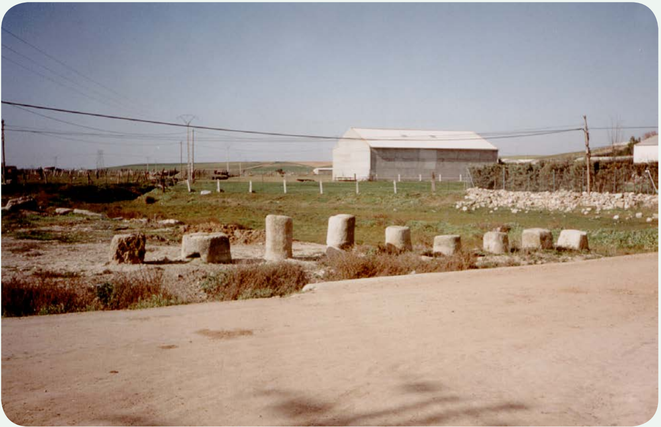
LOCALIZACIÓN ANTERIOR (1). El conjunto de piezas antes del traslado a su ubicación actual en el casco urbano.