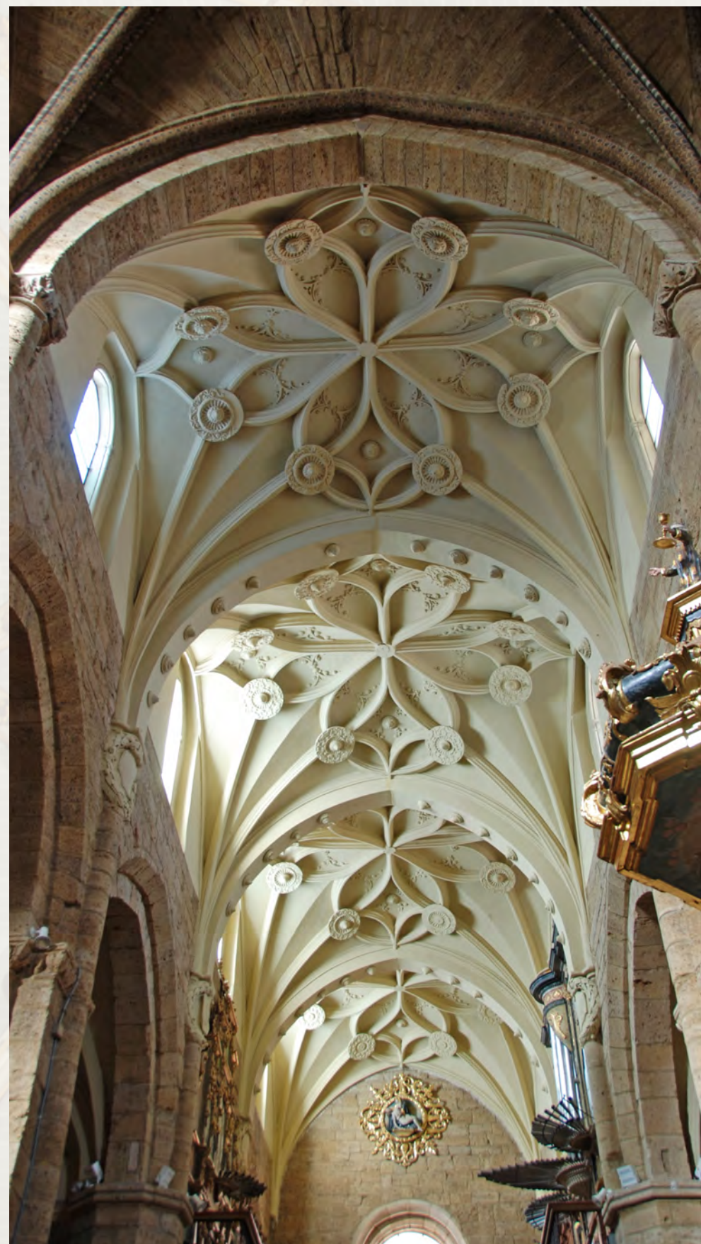
Bóvedas de la nave central (desde la cabecera)