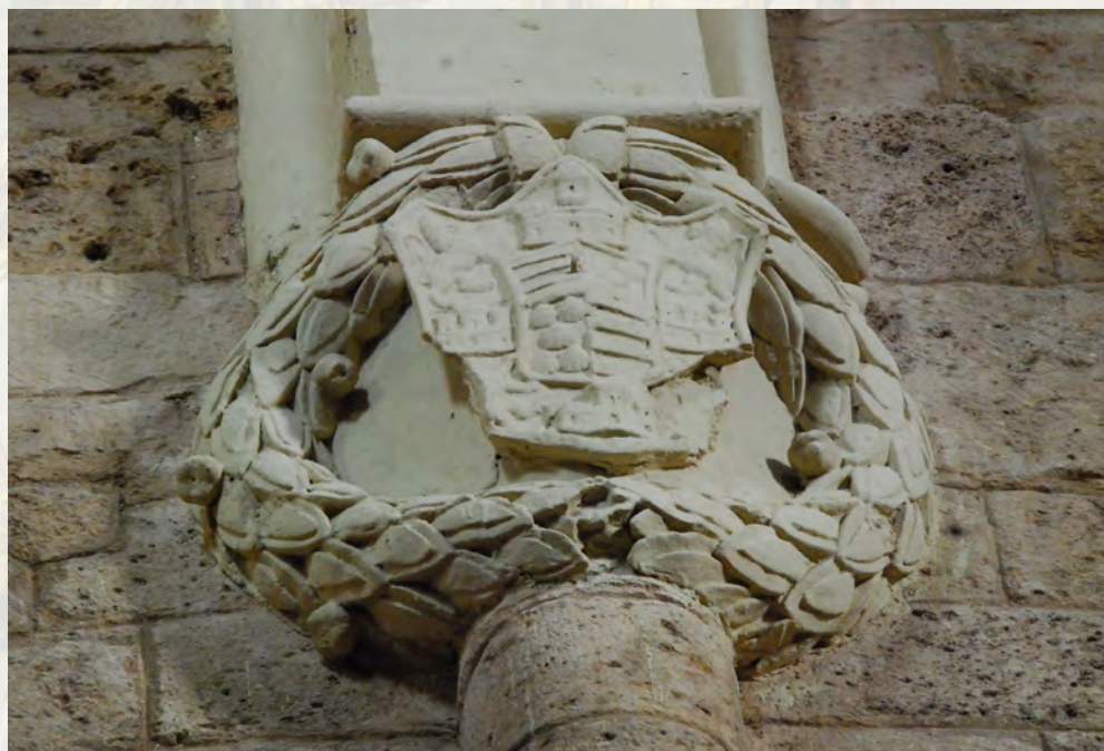
Iglesia de Santa María del Azogue. Escudo de los Condes de Benavente

Bibliografía: Gómez Martínez 1998, 95, 82 y fig. 342; Hidalgo 1998, 36; Hidalgo 1995, 62-66; Redondo 2001, 51; Navarro Talegón 2002, 188-189 y 195; Regueras 2004, 43-44; Vicente 2016, II, 70-84.