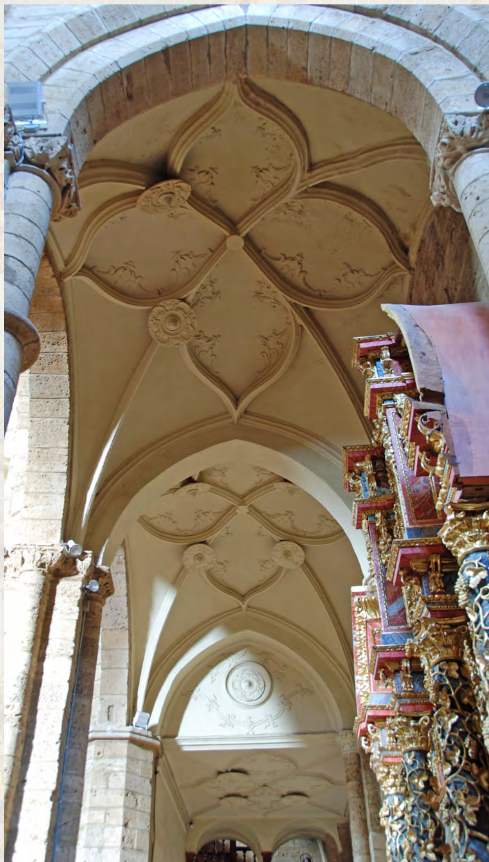
Nave lateral del Evangelio