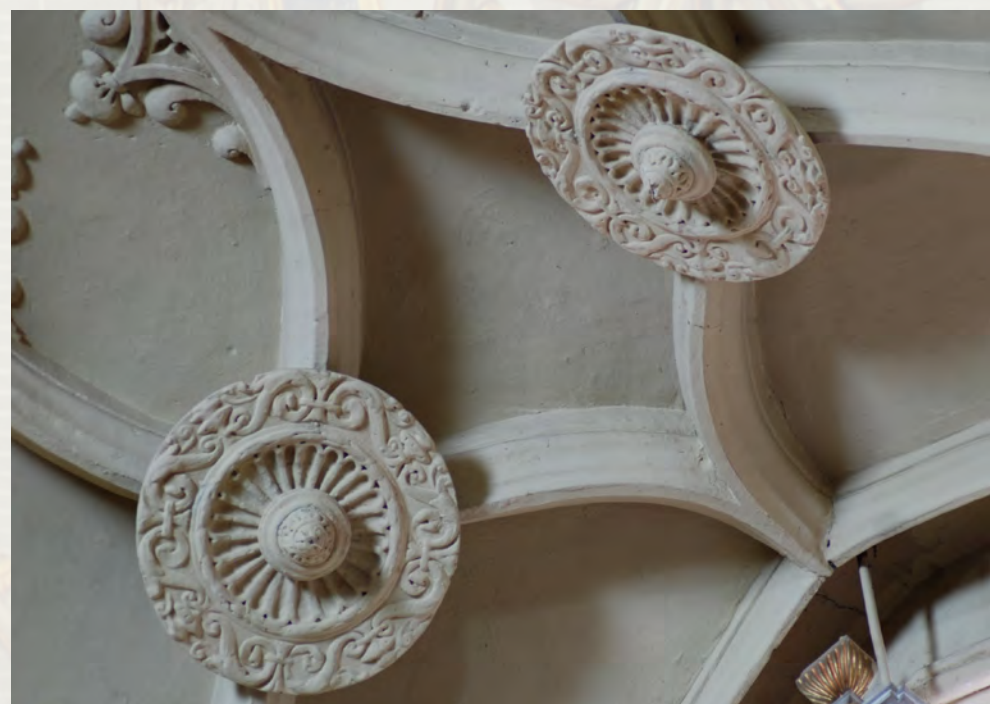
Detalle de las claves y crestería