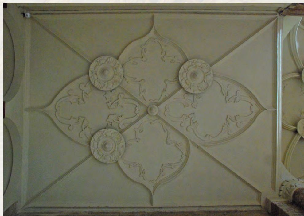
Techo plano del sotocoro