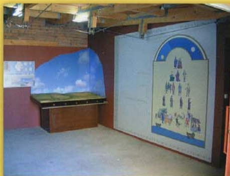
Espacio de recepción del Aula Arqueológica

Partiendo de los datos descubiertos en las antiguas excavaciones arqueológicas realizadas en el poblado y a través de una didáctica y amena instalación expositiva, junto a la recreación de una vivienda de la época y otros elementos de señalización y ambientación de sus ruinas, la visita a Fuenteungrillo aproxima a todos los públicos una amplia información sobre el enclave y sobre las formas de vida en una de tantas comunidades campesinas de la Edad Media.