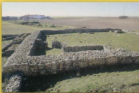
Ruinas consolidadas del castillo

Fundada durante el siglo XI, en el entonces territorio fronterizo entre los reinos de León y Castilla, la villa fue propiedad de diversos señores, laicos y religiosos, hasta que se deshabitó definitivamente en el siglo XV. El poblado estuvo rodeado de una muralla con dos puertas de acceso y contaba además con un pequeño castillo, varias iglesias y cementerios, llegando a alcanzar en sus mejores tiempos una población en torno a las 30 familias.