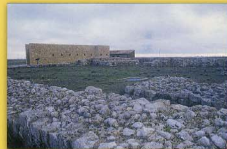
Vista de las ruinas del poblado y las nuevas construcciones

Especial interés ofrecen las ambientaciones de la casa medieval, reproducida fielmente sobre la planta de una de las viviendas del yacimiento, con todos sus enseres domésticos y utillaje, así como los contenidos del Aula Arqueológica, donde, a través de paneles, maquetas, informaciones sonoras y sobre todo, de un atractivo audiovisual, entramos en contacto con el poblado y sus habitantes, tal como fueron hace más de quinientos años.