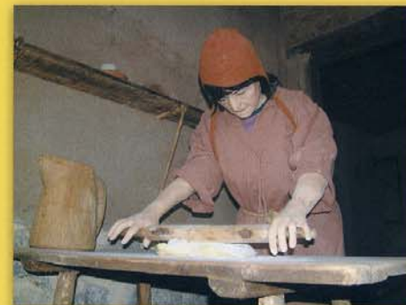
Ambientación de la vivienda medieval con sus habitantes

Especial interés ofrecen las ambientaciones de la casa medieval, reproducida fielmente sobre la planta de una de las viviendas del yacimiento, con todos sus enseres domésticos y utillaje, así como los contenidos del Aula Arqueológica, donde, a través de paneles, maquetas, informaciones sonoras y sobre todo, de un atractivo audiovisual, entramos en contacto con el poblado y sus habitantes, tal como fueron hace más de quinientos años.