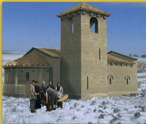
Escena del audiovisual que recrea el poblado y sus gentes