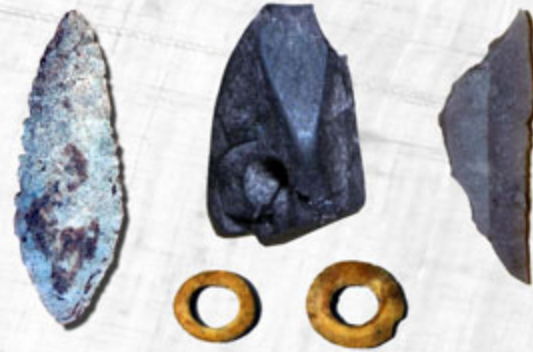
Diversos ajuares hallados en el dolmen

También han aparecido numerosas cuentas de collar, elaboradas en hueso, piedra caliza o lignito (carbón fosilizado), lo que nos da idea del valor que para estas sociedades tenía el adorno personal.