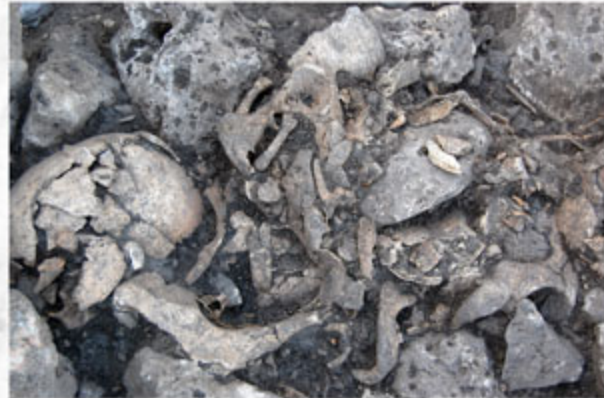
Imagen del osario durante la excavación

La Arqueología nos dice que el dolmen de "El Pendón" fue en origen un gran sepulcro de corredor . Con el paso del tiempo se fue transformando en el monumento que hoy conocemos, en parte como consecuencia de procesos rituales que tuvieron lugar en la Prehistoria y también debido a saqueos y destrucciones de épocas más recientes.