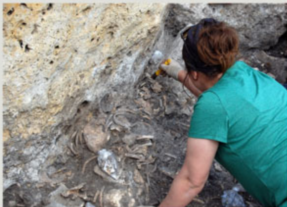
Proceso de excavación