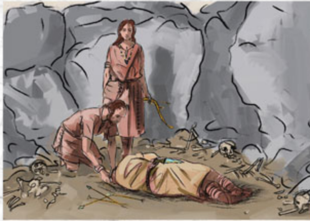
Recreación de una escena funeraria neolítica

Las tumbas megalíticas se construyeron con grandes bloques de piedra llamados ortostatos , disponiendo de un espacio funerario principal conocido como cámara , a la que se accedía a través de un corredor o pasillo, generalmente levantado con piedras de menor tamaño. Esta gran estructura se protegía con un montículo de tierra y piedras, denominado túmulo , que dotaba a toda la construcción de una entidad considerable y de una presencia muy destacada en el paisaje.