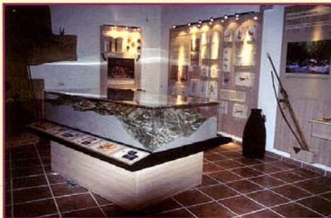
Vista general de la sala del Aula dedicada a las pinturas rupestres.

E l Aula Arqueológica del Valle de Batuecas nos traslada al mundo mágico y espiritual de los antiguos habitantes de este magnífico espacio, en el que diferentes culturas dejaron huella de su paso y de sus creencias. Dos son los aspectos que en el Aula se recogen: la ocupación prehistórica del valle , reconocida a través de las pinturas rupestres que hace más de seis mil años fueron realizadas en los abrigos rocosos del mismo y la historia de Monasterio de San José , fundación carmelita instalada en el valle a partir del siglo XVII y que alcanzó un gran prestigio por su espiritualidad y la estricta norma de su vida eremítica, siendo aún hoy día un frecuente lugar de retiro que produce gran fascinación en sus visitantes.