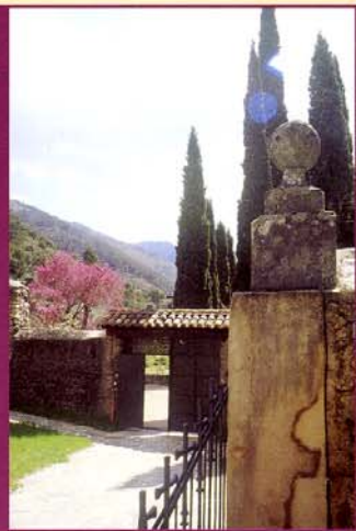
El Valle de Batuecas, desde el Monasterio de San José.