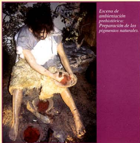
Escena de ambientación prehistórica: Preparación de los pigmentos naturales.