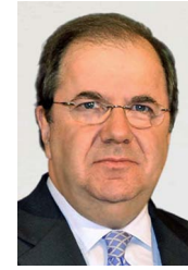
Juan Vicente Herrera Campo Presidente